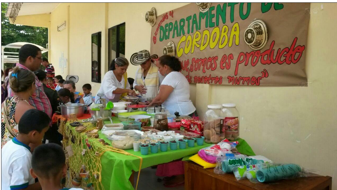
Fotografía 1. Festivales dulces típicos.

Un turismo gastronómico típico del municipio, el cual ofrece una gran variedad de productos locales y del departamento y permite la posibilidad de asistir a feria gastronómicas que se realizan a lo largo del año. ver fotografías platos típicos y festivales de dulces locales ver (Fotografías 1, 2, 3 y 4).