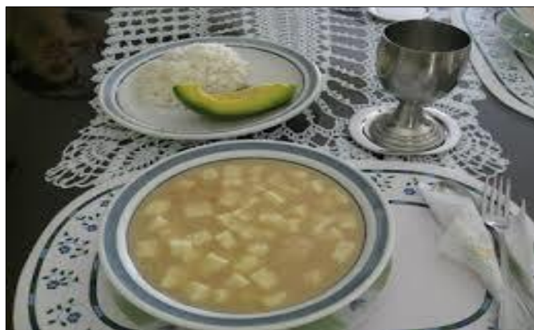
Fotografía 4. Mote de queso.