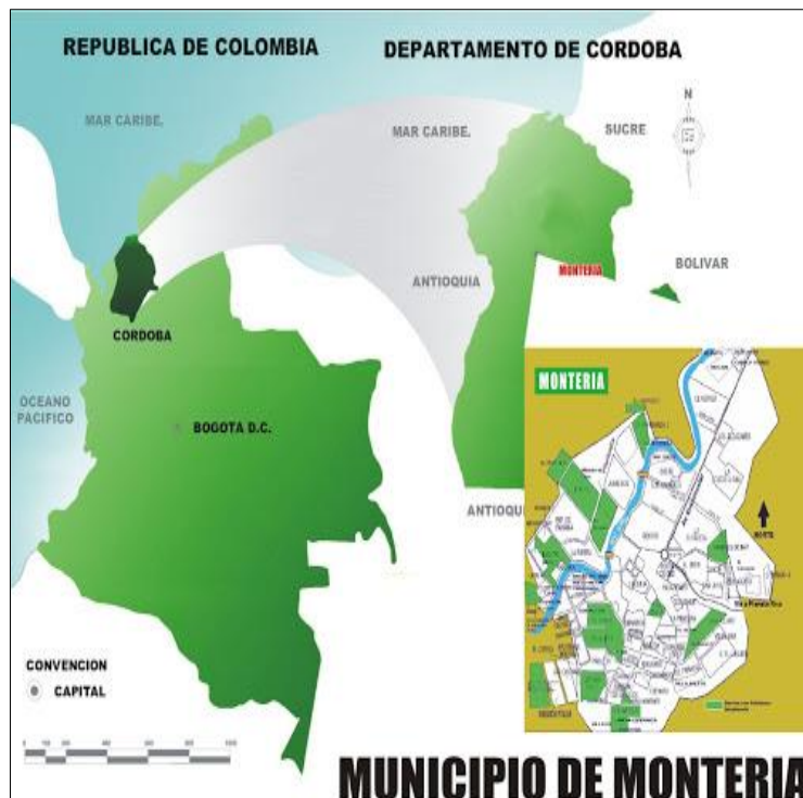
Figura 4. República de Colombia, departamento de Córdoba, Montería.