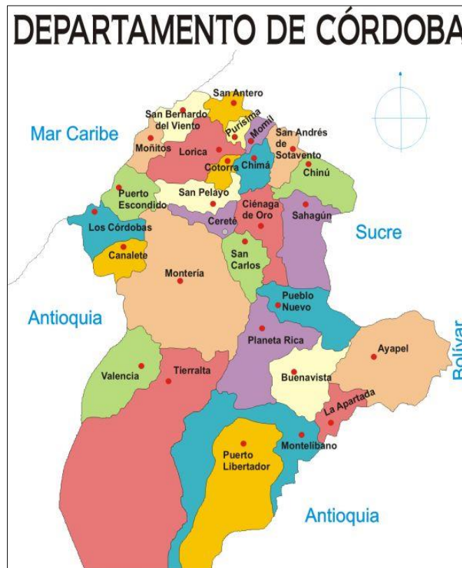
Figura 3. Departamento de Córdoba y sus municipios, incluido Montería (capital)