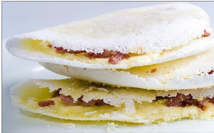
Fotografía 3. Casabito relleno de dulce de guayaba.