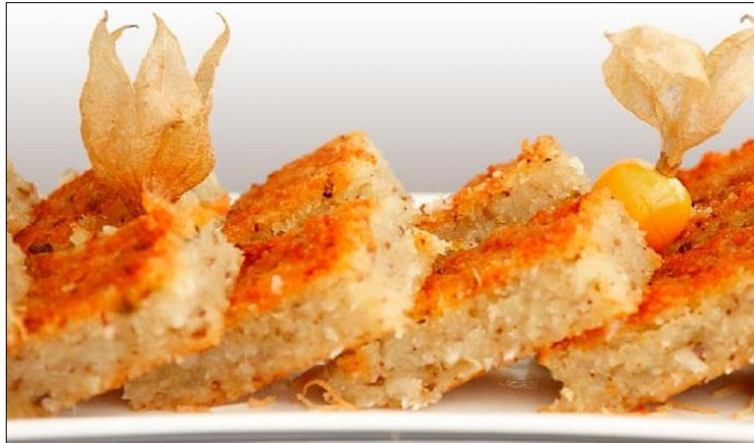
Fotografía 2. Enyucados individuales.