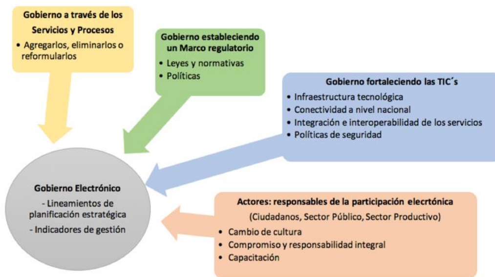
Figura 2. Componentes generales del Gobierno Electrónico