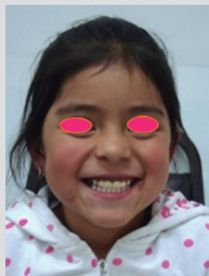
Figure 5. Patient smiling.