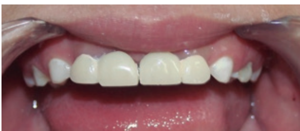
Figura 4. Prótesis Denari cementada.