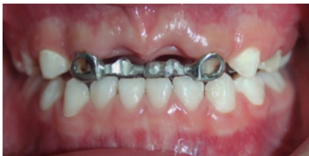
Figura 3. Prueba de metal de la Prótesis Denari.

Una vez mejorado el ambiente oral se rehabilitó el sector anterior eliminando las lesiones de caries de las piezas pilares y aplicando una fina capa de ionómero de fotocurado Fuji LINNING LC (GC) por la parte vestibular y dejando dentina libre al margen de la restauración. Luego se tomaron las impresiones del sector anterior superior e inferior con alginato y un registro de mordida. El modelo de yeso adquirido fue llevado al técnico y junto con él se modelaron las coronas tomando como pilares los incisivos laterales. En la cita final se cementó la prótesis fija con cemento dual RelyX U200 (3M-ESPE) (Figura 3). En el primer control la paciente reportó molestia al hablar, pero contenta al tener nuevos dientes (Figura 4). En los siguientes controles observamos una paciente más extrovertida, habladora y feliz con la prótesis (Figura 5).