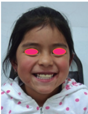
Figura 5. Paciente sonriendo.

Once the oral environment was improved, the anterior sector was rehabilitated by removing caries lesions from the abutments and applying a thin layer of Fuji LINNING LC (GC) photocuring ionomer by the vestibular part and leaving free dentin in the margin of the restoration. Then the impressions of the upper and lower anterior sector were taken with alginate and a bite registration. The model of plaster acquired was taken to the technician and along with the plaster the dental crowns were modeled taking the lateral incisors as pillars. In the final appointment, the fixed prosthesis was cemented with RelyX U200 (3M-ESPE) dual cement (Figure 3). In the first control, the patient reported discomfort when speaking, but happy to have new teeth (Figure 4). In the following controls, we observed a more extroverted, talkative and happy patient with the prosthesis (Figure 5).