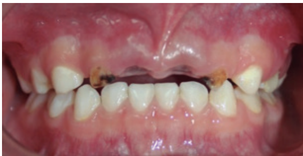
Figura 1. Ausencia de los incisivos centrales superiores, presencia de lesiones de caries activas e inactivas de los incisivos laterales.

En la siguiente consulta se realizó el tratamiento de adecuación del medio bucal, iniciamos con la motivación tanto a la niña como a la madre para mejorar la técnica de higiene bucal; se indicó cepillado 3 veces al día con una pasta que contenga 1100ppm de flúor. Realizamos cuatro controles de biofilm 1 vez por semana con el objetivo de observar la evolución. Se pidió el diario alimentario por 3 días, se observó en promedio 6 golpes de azúcar por día en cortos periodos de tiempo, alimentos en su mayoría carbohidratos y azúcares industrializados, se recomendó incluir alimentos como frutas, verduras y tener periodos de alimentación con mayor tiempo de consumo. En la tercera cita se procedió a realizar la profilaxis dental, se restauraron todos los dientes primarios posteriores superiores como inferiores que presentaban lesiones de caries activas y se aplicó barniz de flúor al 5% Clinpro White Varnish (3M-ESPE). En una cuarta cita se procedió a la extracción de incisivos centrales superiores con gran destrucción coronaria y presencia de fistulas. (Figuras 1 y 2).