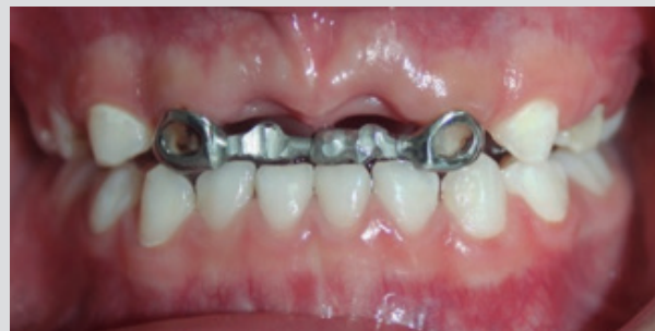
Figure 3. Metal testing of the Denari Prosthesis.

Once the oral environment was improved, the anterior sector was rehabilitated by removing caries lesions from the abutments and applying a thin layer of Fuji LINNING LC (GC) photocuring ionomer by the vestibular part and leaving free dentin in the margin of the restoration. Then the impressions of the upper and lower anterior sector were taken with alginate and a bite registration. The model of plaster acquired was taken to the technician and along with the plaster the dental crowns were modeled taking the lateral incisors as pillars. In the final appointment, the fixed prosthesis was cemented with RelyX U200 (3M-ESPE) dual cement (Figure 3). In the first control, the patient reported discomfort when speaking, but happy to have new teeth (Figure 4). In the following controls, we observed a more extroverted, talkative and happy patient with the prosthesis (Figure 5).