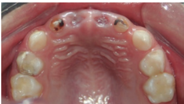
Figura 2. Vista intraoral maxilar superior

tal surface, a modified periapical radiograph was taken to visualize the state of the roots of the upper incisors.