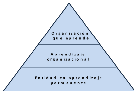
Fig. 1. Niveles a alcanzar por la organización

Para que una organización logre estos resultados sería factible un nivel inferior (Figura 1) donde esté en constante desarrollo el potencial educacional (proceso de capacitación); se equilibre la ejecución de las actividades en correspondencia con las necesidades para cumplir los objetivos propuestos y se logre optimizar el empleo de los recursos; lo que se induce del concepto de Entidad en Aprendizaje Permanente (EAP), enunciado por Morales (2009) y refrendado en las Normas Cubanas 3000:2007 como: una condición que se alcanza por la organización cuando demuestra que realiza una actividad formativa continua y se caracteriza por la efectividad en la capacitación y desarrollo de los recursos humanos, con alto impacto en la productividad, eficiencia y calidad [6;19].