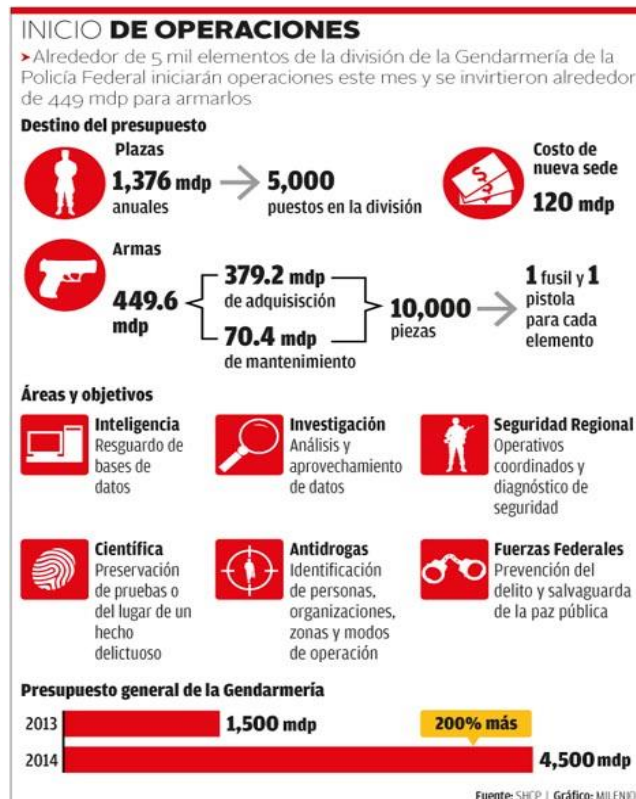
Figura 1. Inicio de operaciones de la Gendarmería 12

manifestando que la función del Ejército no era perseguir delincuentes 10 . A esto añadió la incertidumbre con la que las tropas afrontan su tarea de seguridad pública, dado que no hay una ley que regule esta situación, que deje claras las responsabilidades del Ejército en labores de seguridad pública 11 . De alguna forma, el representante de la SEDENA reivindicó una mejora de la seguridad jurídica a la hora de actuar.