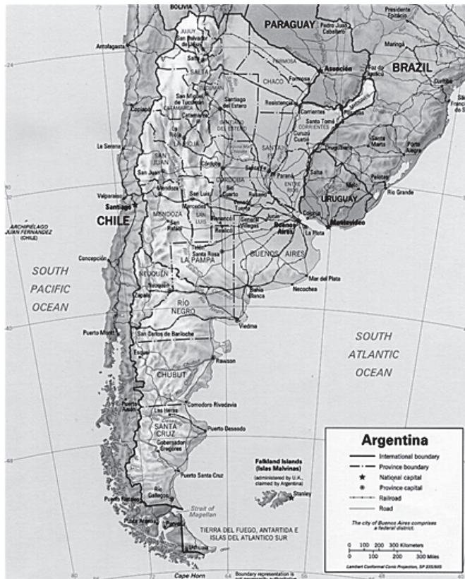
Figura 1. Argentina

La situación geográfica de la Argentina es un dato significativo que ayuda a entender la dinámica que han adquirido las organizaciones criminales en los últimos años, especialmente aquellas relacionadas al tráfico de drogas. Como se puede ver en la figura 1, Argentina limita al norte con Bolivia y Paraguay, al tiempo que comparte la frontera al noreste con Brasil. Argentina limita al norte con Bolivia y Paraguay, al tiempo que comparte la frontera al noreste con Brasil.