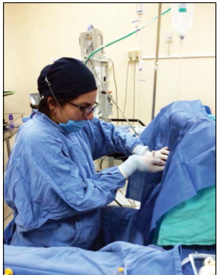
Figura 1. Bloqueo intratecal. Paciente en decúbito lateral izquierdo. Médico especialista en anestesiología previa asepsia, antisepsia y colocación de campos estériles lleva a cabo la punción lumbar a nivel de espacio L1-L2.

Después de la cirugía permanecieron en el área de recuperación, para evitar sesgos; en la recolección de datos se designó personal capacitado ajeno a la investigación con instrucciones de registrar