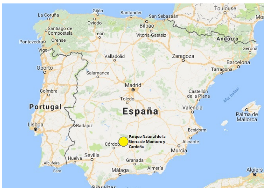
Figura 1: Situación del Parque Natural de la Sierra de Cardeña y Montoro.