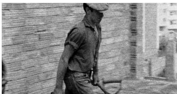
Figura 2. Fotograma de El largo viaje hacia la ira , 1969

com o pensamento simplificado de uma objetividade ou uma representação que se esquecem das derivas observadores-observados/observação-interpretação.