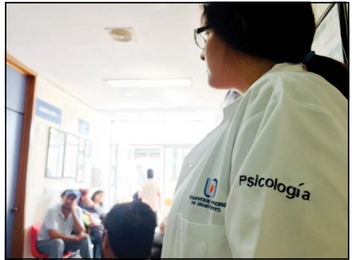
Figura 3. Alumna de la Licenciatura en Psicología de la Universidad Autónoma de Aguascalientes en trabajo de campo clínico.

A partir del presente estudio se concluye que a medida que el comportamiento suicida implica un riesgo mayor, como en el caso de la autolesión, son menos las variables que tienen un efecto significativo sobre el mismo. En esta población de estudiantes lo que predice la autolesión es la experimentación de sucesos vitales estresantes, aunada a la presencia de un déficit en sus recursos afectivos, en específico los relacionados con autocontrol y con el manejo de la tristeza. En lo que respecta al comportamiento suicida que implica menor riesgo de letalidad como la ideación suicida, el número de