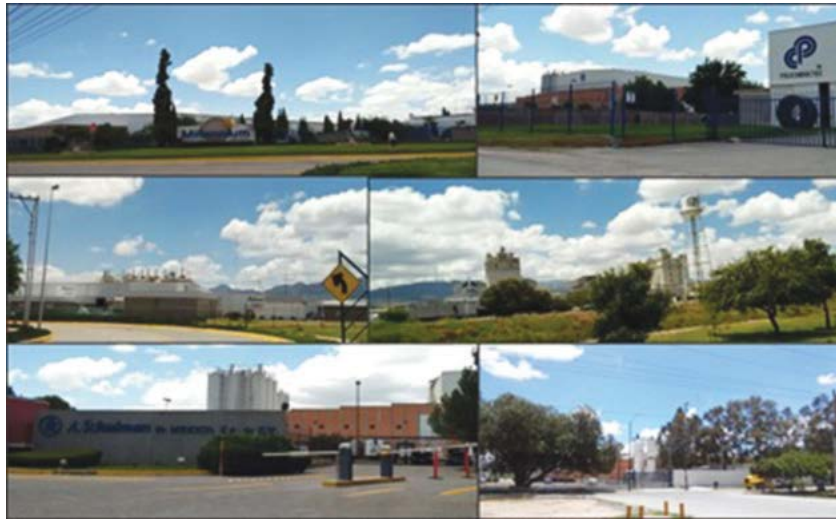
Figura 1. Imágenes de empresas manufactureras ubicadas en la zona industrial de San Luis Potosí.

donde: CO_2/E es la intensidad de carbonización de la energía o índice de carbonización, que son las toneladas de CO_2 ( tCO_2 ) generadas en el sector manufacturero en función de la energía ( E ) consumida por el uso de combustibles en el ramo (toneladas de CO_2 por cada barril equivalente de petróleo, BEP); E/PIB representa la intensidad energética en función de la renta económica, en este caso es la cantidad de energía requerida para producir mil unidades del PIB del sector manufacturero (BEP por cada 1,000 pesos de PIB); PIB/P , es la renta económica per cápita del sector (miles de pesos por habitante); y P es la población (número de habitantes en el estado). La Ecuación (1) se puede reescribir como: