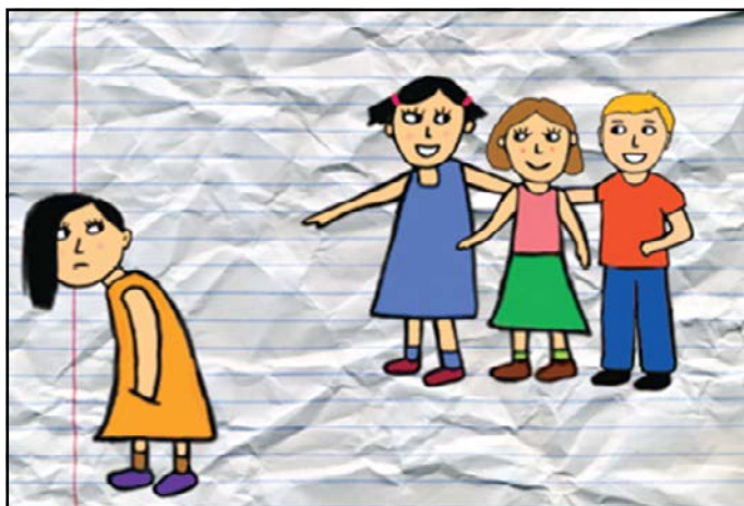
Figura 3. La exclusión, la burla y el rechazo de los compañeros son formas de exhibir el bullying, a partir de allí se escala a niveles incluso antisociales como lastimar con armas, golpizas, entre otras. Imagen realizada por Víctor M. Santos Gally: portada del libro Bullying los Múltiples Rostros del acoso escolar (Mendoza González, 2014).

Los resultados de la prevalencia identificados en el contexto educativo urbano en este estudio son similares a los de otros países, en los que la prevalencia del rol de acosador es mayor al de víctima (Méndez y Cerezo 2010, Mendoza, 2011, Mendoza, 2012); sin embargo, el porcentaje de participantes como víctima y acosador es mucho menor al reportado en países de primer mundo (Kristensen y Smith, 2003), ello puede deberse a la legitimización del uso y justificación de la violencia en la sociedad mexicana, en la que es natural emplearla en lo cotidiano en todos los ambientes sociales: político, económico, cultural y por supuesto, en el ámbito educativo, en donde se identifican en nivel primaria niveles de conducta social similares a los identificados en la sociedad como pago de derecho de piso, organización de peleas cobrando la entrada por los propios estudiantes, pagar a otros alumnos para golpear a un alumnado determinado, entre otras, como una forma de instrumento para lograr metas (Figura 3).