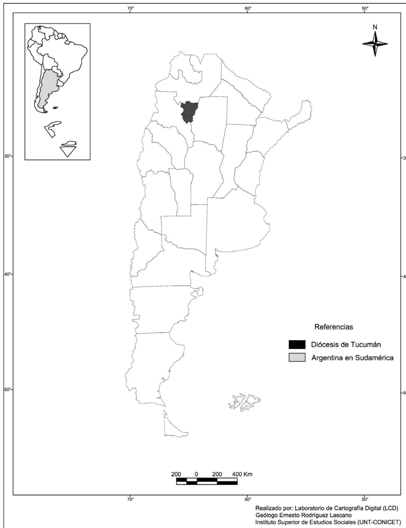
Mapa 1. Ubicación de la diócesis de Tucumán en Argentina (división política)