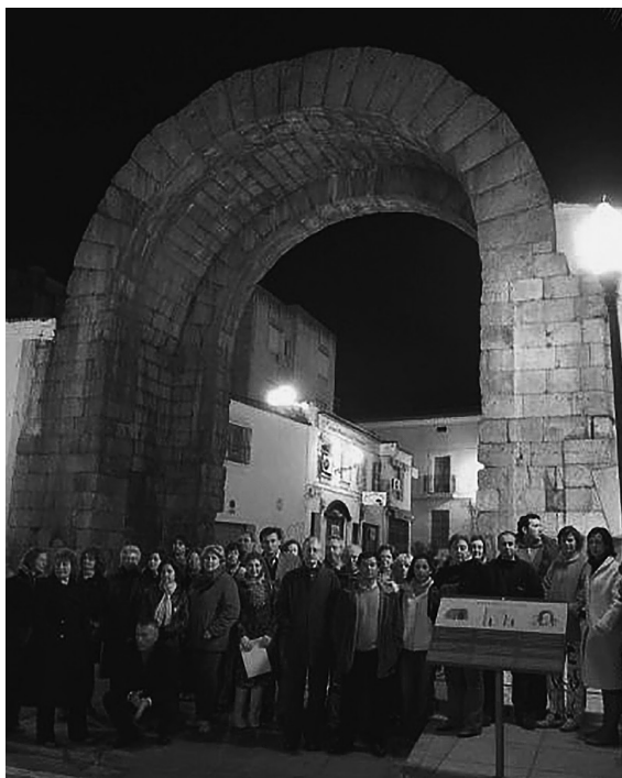
FIG. 3. Mecenas frente al Arco de Trajano.