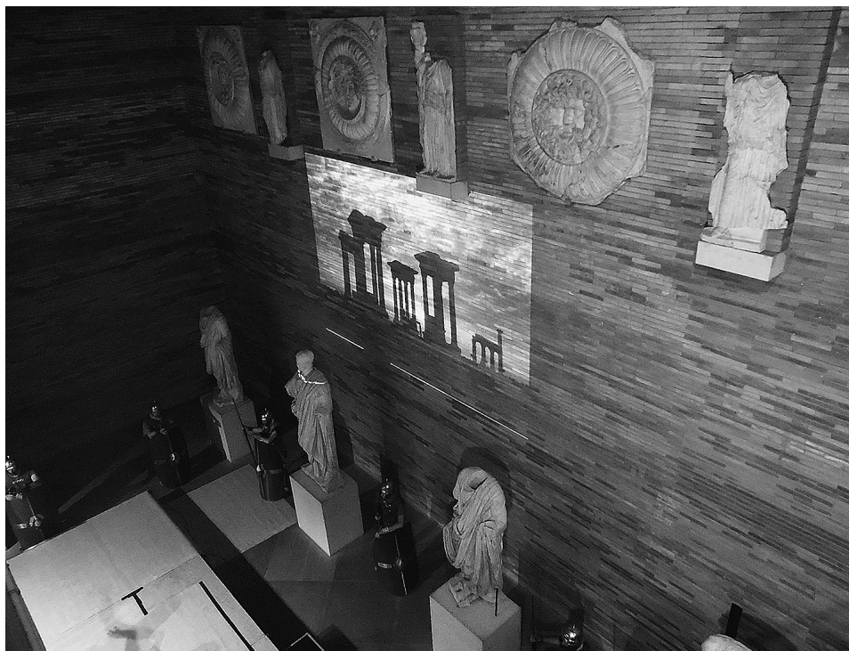
FIG. 10. Recreacinismo en homenaje a Zenobia y a la ciudad de Palmira, por la Asociación Ara Concordiae, en la nave central del Museo Nacional de Arte Romano, durante «Emerita Lydica» 2015.

Ambos proyectos están relacionados y se han realizado actividades comunes entre técnicos de ambas ciudades romanas 19 .