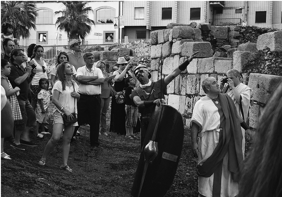
FIG. 9. Soldado romano en una visita guiada al espacio arqueológico de Morerías (Mérida), durante «Emerita Lydica» 2015.

ción y la sociedad local, no solo en la difusión, sino en la participación de todas las actividades (Fig. 9). Todas las recreaciones las lleva a cabo la población emeritense con un gran índice de implicación y un gran rigor en el recreacionismo 17 : gladiaturas en el Anfiteatro, representaciones teatrales en el Teatro romano, cultos religiosos en el Templo de Diana, campamento de los legionarios romanos en las murallas, recreación funeraria en los Columbarios, etc. Los emeritenses adoptan nombres de sus homónimos de la colonia Augusta Emerita , se visten con rigor histórico y la música y los olores transmiten sensaciones a los visitantes que la disfrutan.