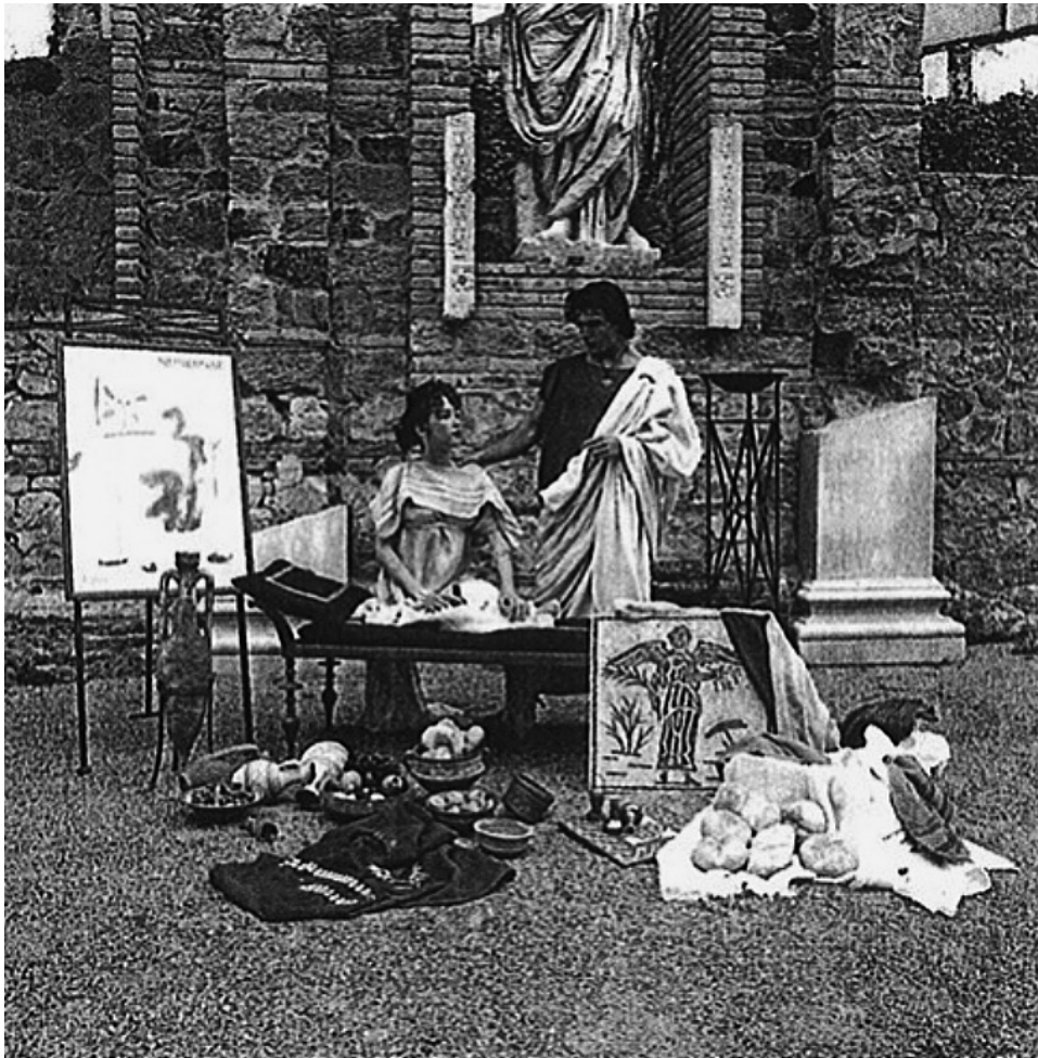
FIG. 7. Escena de recreacinismo de «Nundinae» en el Foro de la colonia Augusta Emerita.

ciudadanos y turistas. Es más, la proyección del rigor científico y cultural del museo se transmitió a la vida cotidiana de la sociedad, interesada por su historia y por su pasado, interesada por su patrimonio (Fig. 7).