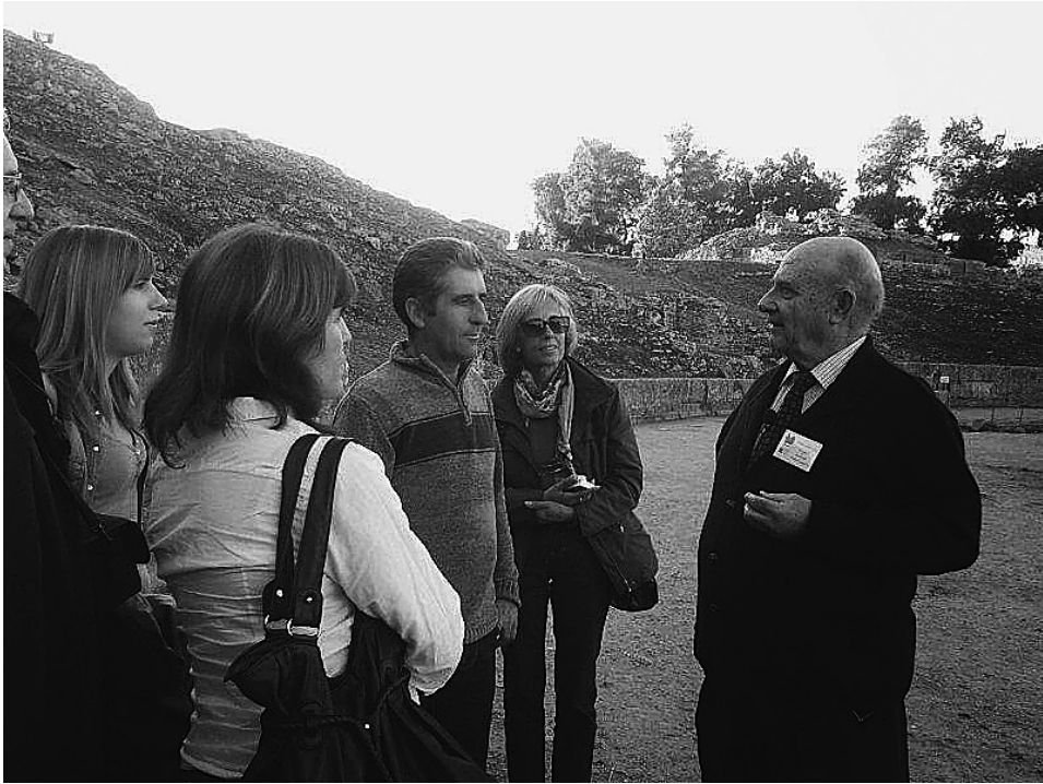
FIG. 6. Emérito realizando una visita guiada.

a los turistas y usuarios en determinados días y en espacios patrimoniales concretos.