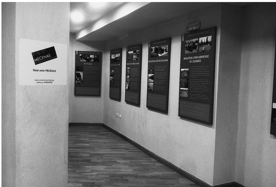
FIG. 4. Exposición de los proyectos del Programa Mecenas. Centro de Interpretación del Mosaico (Mérida).