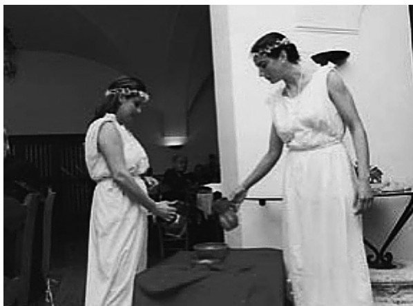
FIG. 8. Escena de «Nvndinae» en Mérida.

aumento de la oferta de productos culturales en establecimientos cercanos. Nundinae supuso algo más que la representación teatral o histórica de un mercado romano, supuso la elevación de Augusta Emerita como centro de interpretación social de la cultura romana, de su vida cotidiana, de los emeritenses.