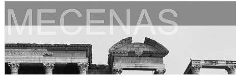
FIG. 2. Logo del Proyecto Mecenás.

El programa Mecenás surge desde el Consorcio de la Ciudad Monumental de Mérida con el objetivo de la realización de un proyecto anual de adecuación, conservación y/o difusión de un espacio patrimonial emeritense (Fig. 2).