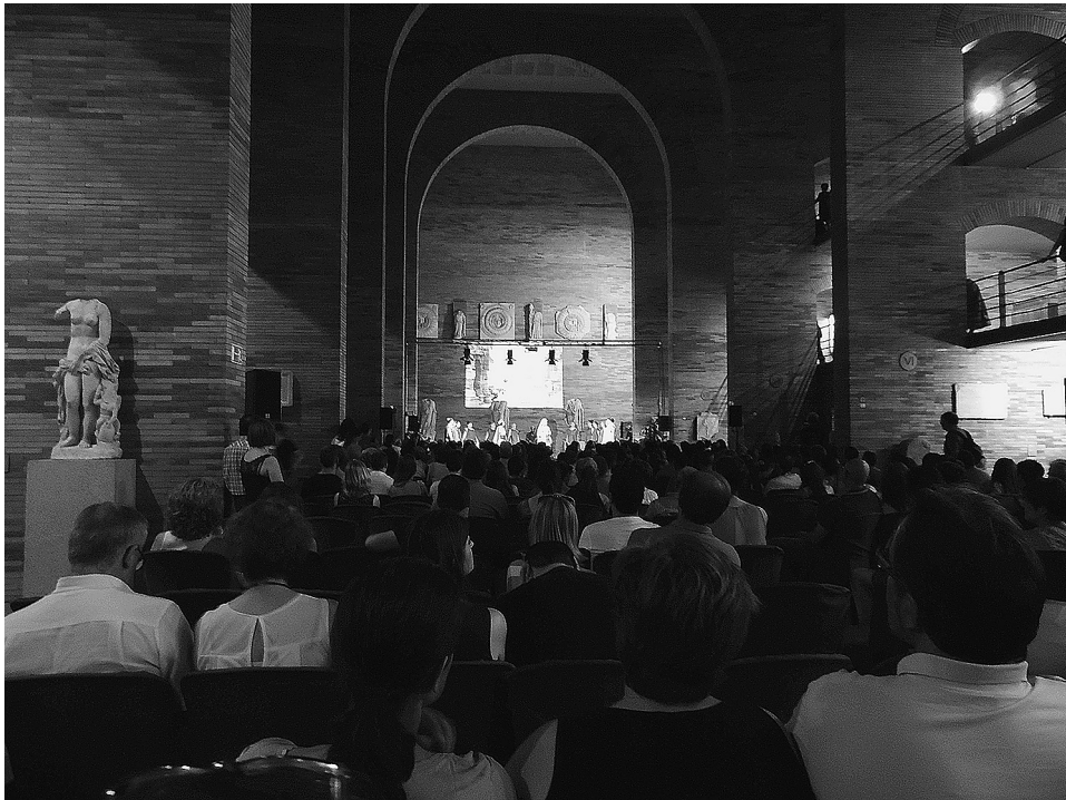
FIG. 11. Recreacinismo en homenaje a Zenobia y a la ciudad de Palmira, por la Asociación Ara Concordiae, en la nave central del Museo Nacional de Arte Romano, durante «Emerita Lydica» 2015.