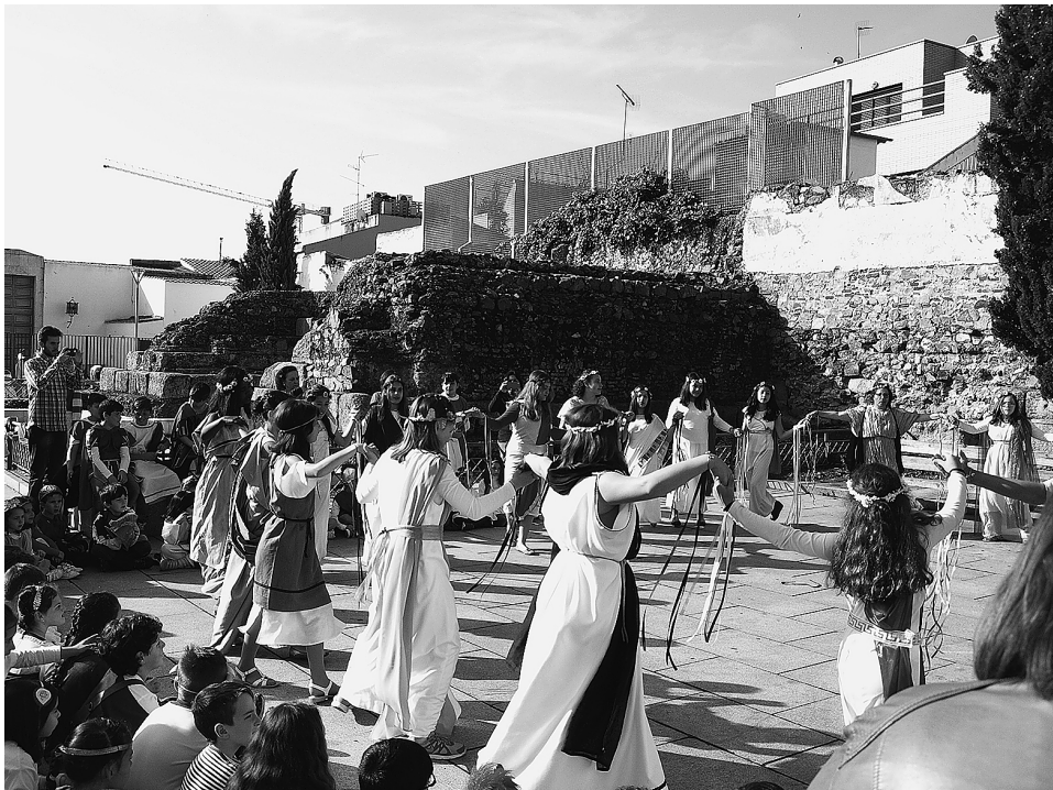
FIG. 1. Danza romana en el Castellum Aquae de Mérida. Día de los Monumentos y Sitios 2015.

Actualmente están adscritos al proyecto más de 25 centros escolares e institutos. La implicación del profesorado es esencial ya que, desde que adoptan su monumento, se incluye como contenido transversal en las asignaturas con las adaptaciones correspondientes según el currículo de cada etapa escolar desde Educación Infantil hasta Bachillerato. Realizan actividades culturales relacionadas con su monumento en el Día Internacional de Monumentos y Sitios (18 de abril); dichas actividades se programan en su monumento, cobrando vida y uso social estos espacios patrimo-