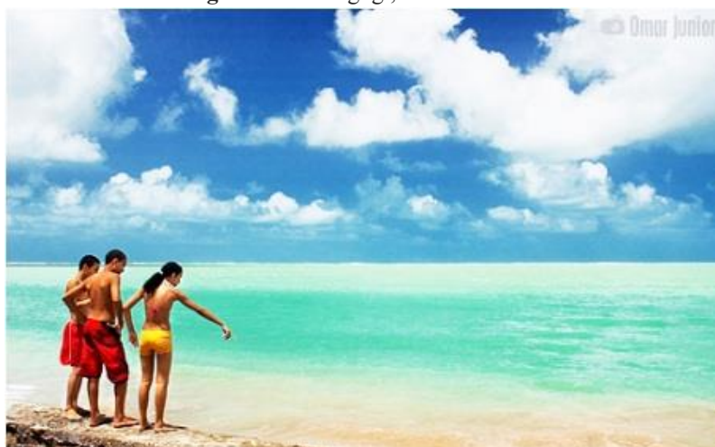
Figura 2 – Maragogi, AL