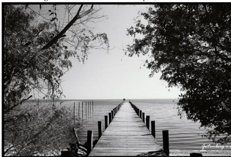
Figura 3 – Ponte de madeira – Itapuã, RS

Na terceira página de busca encontramos a seguinte imagem: