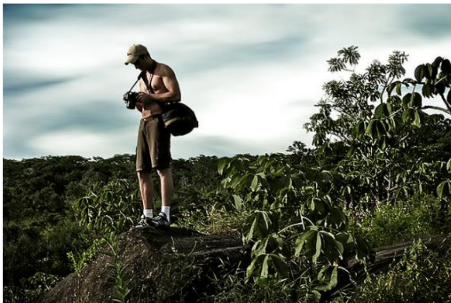
Figura 4 – Chapada dos Veadeiros, GO