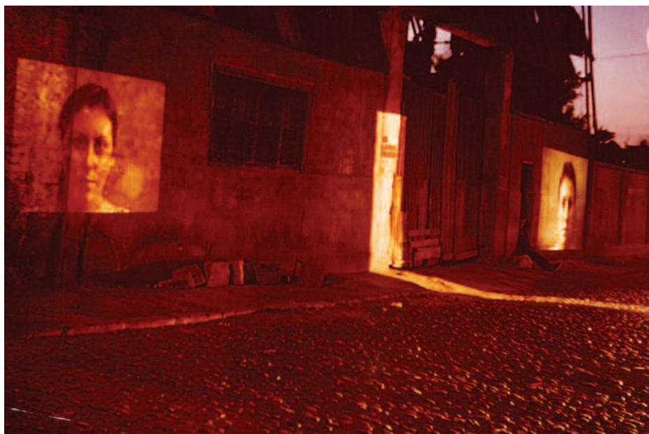
Zonas de dolor I . Proyección del rostro de la protagonista en las paredes del barrio.

apertura que está unida al placer no como tensión, sino como alivio. La puesta en escena de Zonas se abre con la imagen de la protagonista sentada en lo que puede ser una escalinata o la acera. La imagen se centra en el rostro y, luego, lentamente baja hacia sus pies descalzos. Lo que vemos no es el dolor provocado por las heridas, sino una imagen provocativa por el uso de la luz y sombra en su rostro. El fondo oculto trae la fragmentación reflejada en los cortes de sus manos y pies, pero sin perder el horizonte de la totalidad de su propuesta estética y política. El juego de claroscuro también aparece en la escena siguiente: una proyección de la cara del personaje sobre las paredes externas del lugar donde se realiza esta acción de arte.