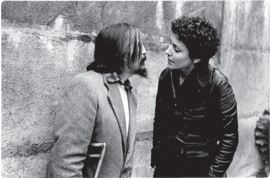
Zonas de dolor III . “El Beso”.

cantante que provoca un quiebre paródico en el montaje de la escena y nos lleva a pensar el folletín despechado de las novelas rosas. 15