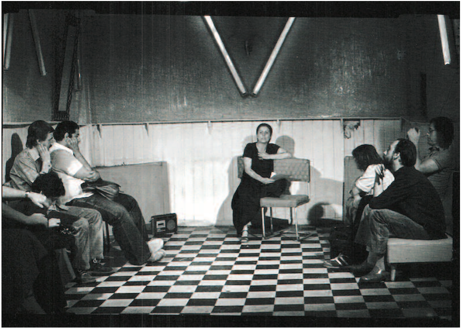
Zonas de dolor II . Segundo encuentro con los pobladores y visitantes del prostíbulo.

detalles cotidianos fundamentales en su vida diaria. De ahí que la apuesta estética de esta obra sea la conformación de una especie de comunidad del disenso, o sea, una comunidad que pueda reunir a los excluidos que habitan los márgenes.