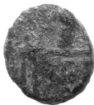
LÁMINA (X 2)