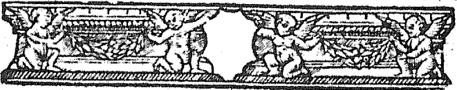
Portada de Florida Corona. Vid. núm. 8.º.