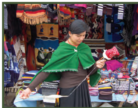
Figura 2. Nativa de Salazaka hilando. Esta es una práctica ancestral para obtener las fibras con las que se tejerán varios textiles.

En la ciudad de Ambato la práctica del diseño gráfico está en auge, motivada por el avance de la industria y el comercio. Se estima que los diseñadores gráficos de profesión son un número limitado frente al extenso grupo de diseñadores "empíricos". Estos últimos se dedican al diseño sin un conocimiento técnico que les permita