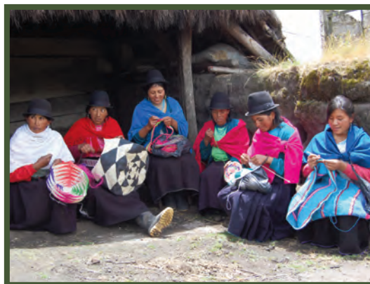
Figura 1. Grupo de Indígenas del poblado de Quisapincha tejiendo shigras (tipo de bolso tejido con hilo de cabuya). Se puede observar el colorido del diseño, el equilibrio, proporción y armonía de sus formas.

estos pueblos las comunidades de Salazaka, Chibuleo y Quisapincha, en donde se encuentra un diseño iconográfico casi intacto heredado de su ancestro indígena. Este apego a la cultura indígena se pone de manifiesto en toda su creación gráfica, convirtiéndose así en ejemplo admirable de poseer una identidad cultural muy bien definida.