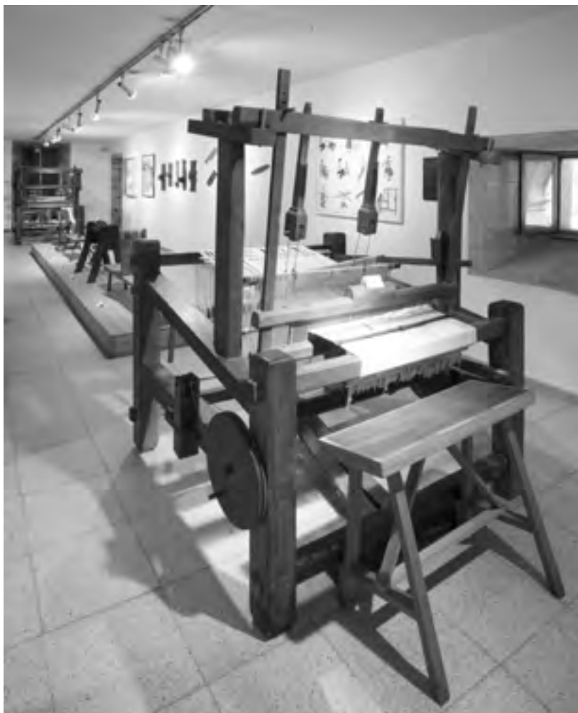
MPG: sala do tecido

En canto á especialización ou categorización patrimonial no ámbito que compete ao Museo do Pobo Galego, vemos que na Lei 5/2016 múdase a denominación de patrimonio etnográfico por patrimonio etnolóxico. Así, no título VIII dedicado aos bens