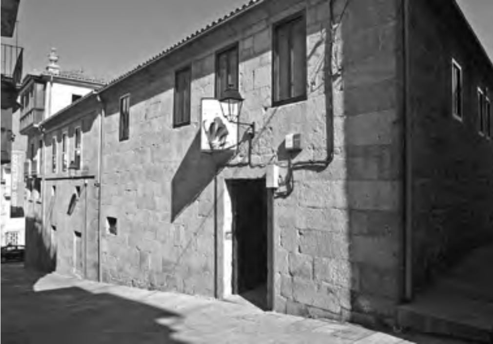
Museo Etnolóxico de Ribadavia