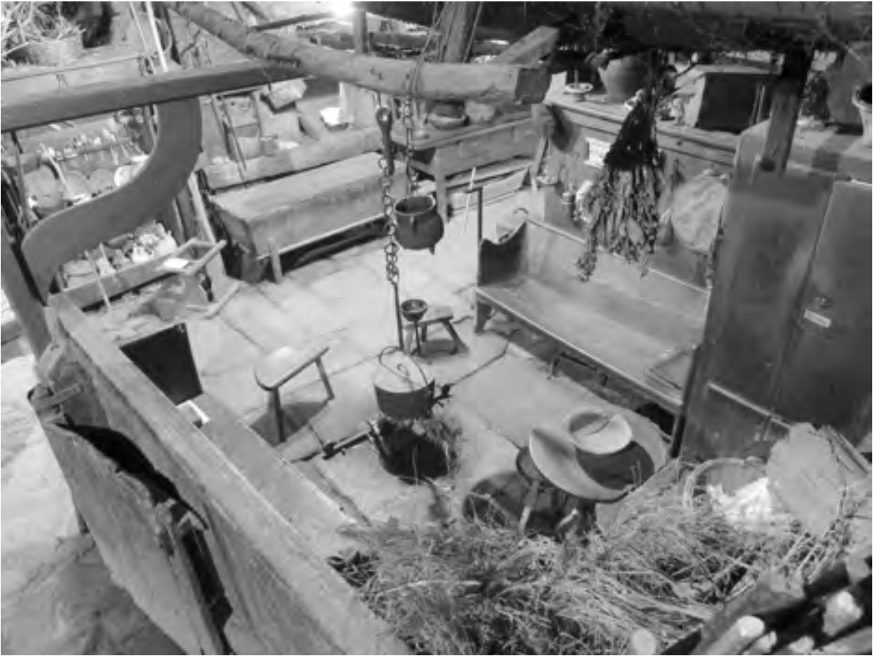
Palloza - Museo "Casa do Sesto" (Piornedo - Cervantes)

rística de ser unha institución plural que aglutina a persoas de diferentes ámbitos de coñecemento, intereses e tamén a diferentes institucións. Na tríade (obxecto - suxeito - axente) que establecemos no apartado anterior, este eixo respondería ao recoñecemento do museo como un grupo diverso de persoas e, tamén se admite que este grupo é quen de crear, e non só de recrear, os valores implícitos no patrimonio cultural incluíndo as versións identitarias. Parécenos interesante salienta este aspecto pois, a formulación coordinada de vontades e o interese do museo por integrar obxectos, suxeitos e axentes, implica recoñecer que o Museo do Pobo foi desenvolvéndose desde a vangarda das institucións museais e sociais.