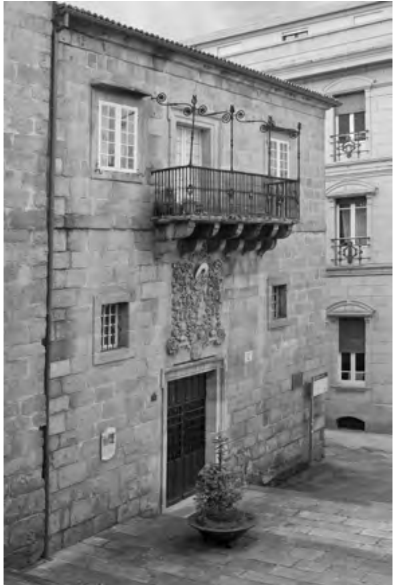
Museo Arqueolóxico Provincial de Ourense

En relación co segundo grupo de razóns, no Decreto salientase que o Museo do Pobo Galego é unha insti-