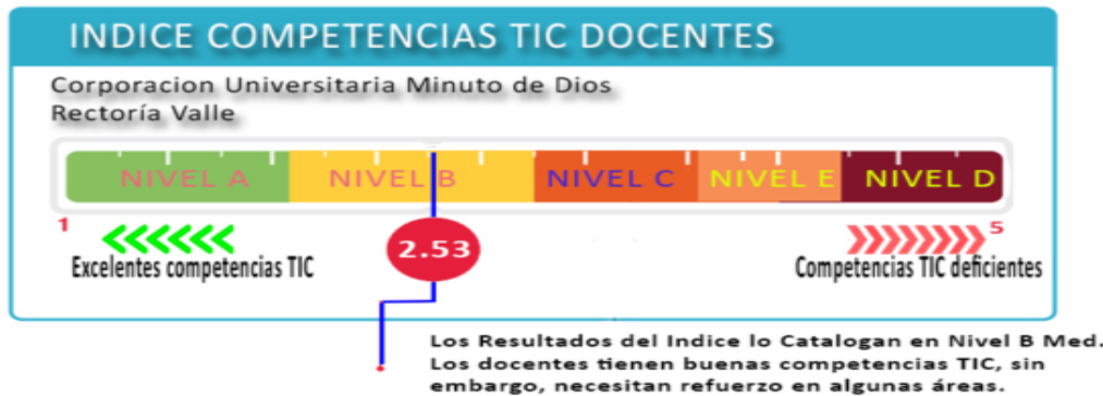
Figura 2. Índice de competencias TIC en docentes Resultados y clasificación del índice de competencias TIC para el estudio de caso.

El índice de competencias TIC para el estudio de caso presentó un valor de 2,53 con una ubicación promedio en el nivel B tal como se registra en la figura 2. Los valores para las diferentes competencias oscilaron 2,13 y 3,14 con una ubicación entre los niveles B y C en la interpretación de competencias básicas para un docente tal como se muestra en la figura 3. Los resultados detallados de las variables componentes de cada competencia se describen en la tabla 4.