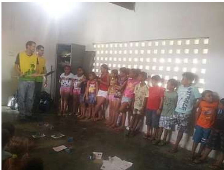
Ilustração 1 – Oficina de Higiene Bucal na Operação Porta do Sol do Projeto Rondon em Janeiro de 2015.

O Centro Universitário São Camilo (CUSC) participa Projeto Rondon desde 2011 e a Oficina de Saúde Bucal é realizada em todas as operações (Ilustração 1), orientando crianças e munícipes sobre a importância de se cuidar e escovar os dentes corretamente. Tudo através de breve aula expositiva e de dinâmicas lúdicas sobre a escovação correta, incentivando o uso da escova, cremes dentais e fio dental.