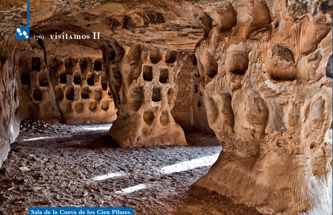
Sala de la Cueva de los Cien Pilares.

por pilares y cuyas oquedades, puertas y ventanas, abiertas en su fachada constituyen una impresionante y reconocible estampa. Se trata de una pared de arcilla y arenisca excavada en altura en varios pisos, hasta cinco, y en longitud aproximadamente de 300 metros.