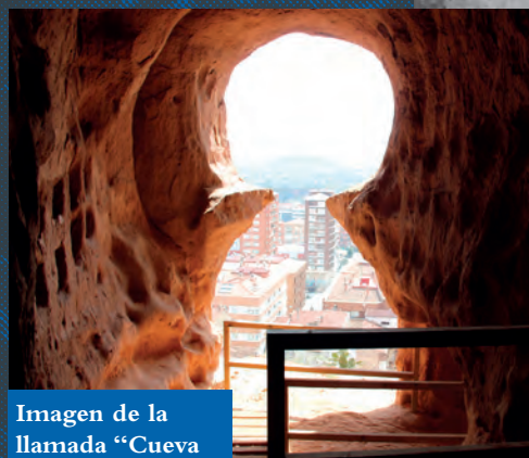
Imagen de la llamada “Cueva de la Cerradura”.