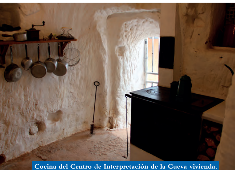
Cocina del Centro de Interpretación de la Cueva vivienda.

Dentro del complejo, también encontramos otros guiños a la vida en las cuevas como el espacio dedicado a “la cultura del