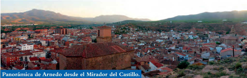
Panorámica de Arnedo desde el Mirador del Castillo.

cientos de cuevas que nuestros antepasados han excavado a lo largo de los siglos, utilizando herramientas muy simples: picos, palas, punteros, cedazos.... construcciones que se encuentran en muchos lugares de La Rioja, pero que en Arnedo ha adquirido, una mayor dimensión y complejidad.