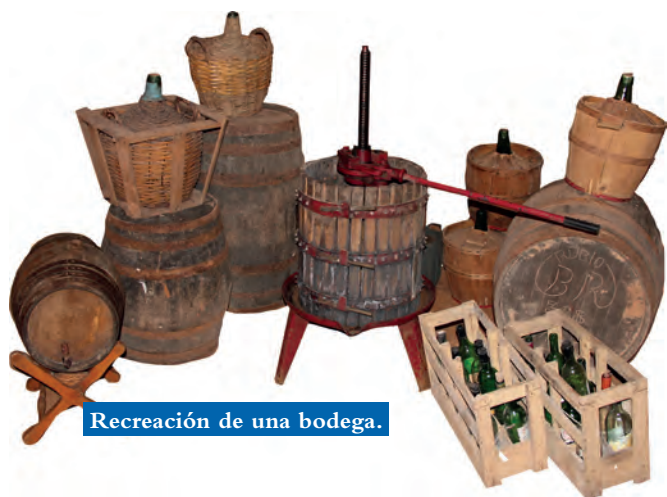
Recreación de una bodega.

Estas concentraciones de eremitas, en muchos casos, terminarían dando origen a auténticos monasterios rupestres. Así en el S. XI, el entonces Señor de Arnedo, Sancho Fortunionis, deja constancia en su testamento de la existencia de un “antiguo Monasterio de San Miguel” de su propiedad. La