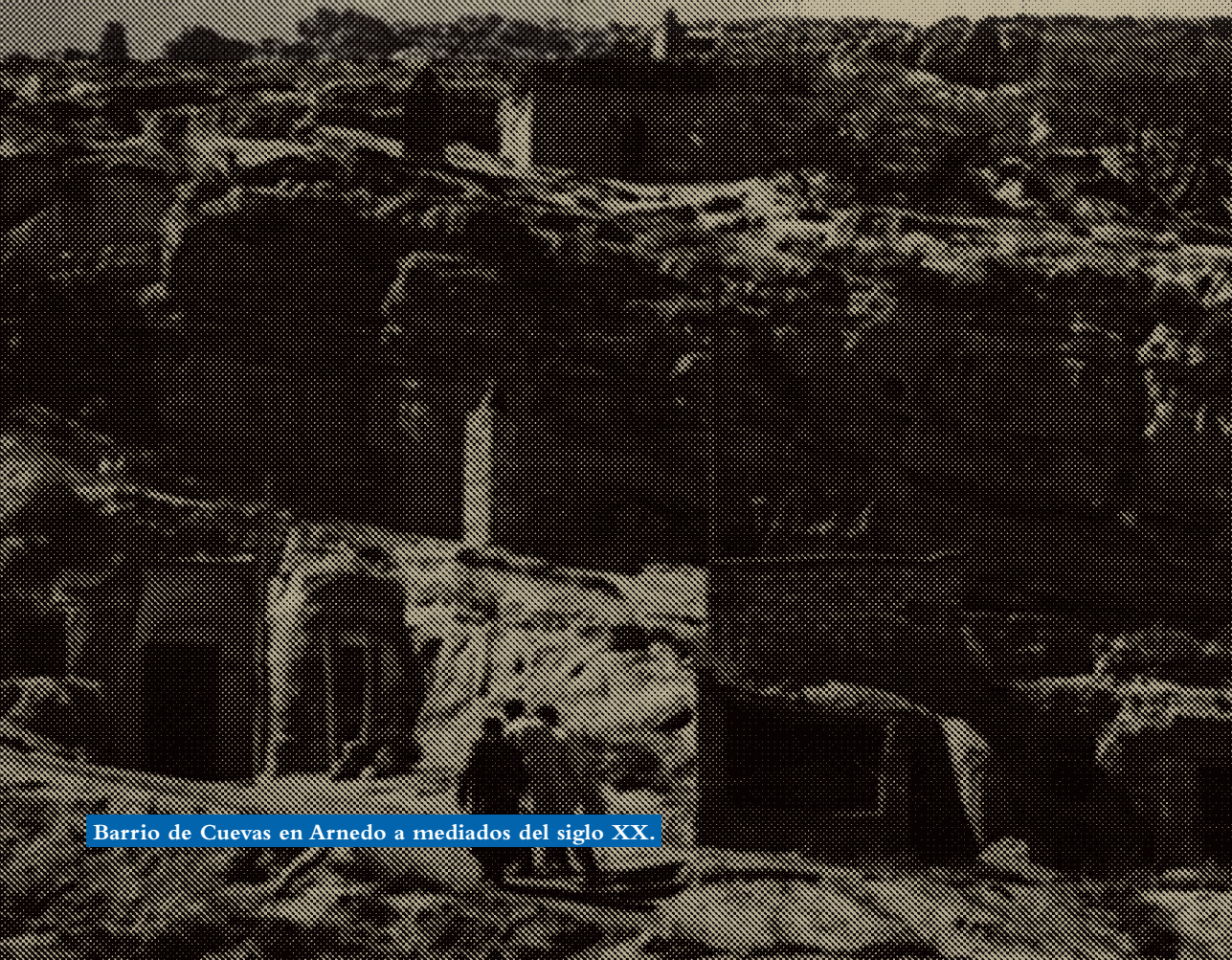
Barrio de Cuevas en Arnedo a mediados del siglo XX.

El escarpado paisaje del valle medio del río Cidacos (y, sobre todo, Arnedo) es el enclave rupestre por excelencia de La Rioja, debido a la existencia de un gran número de cuevas artificiales, de gran valor histórico y etnográfico.