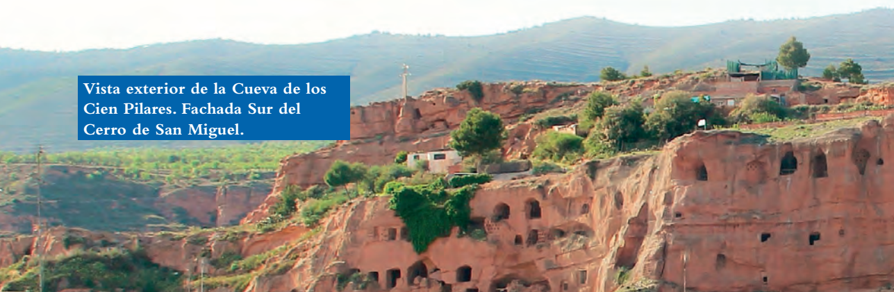
Vista exterior de la Cueva de los Cien Pilares. Fachada Sur del Cerro de San Miguel.