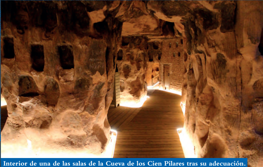
Interior de una de las salas de la Cueva de los Cien Pilares tras su adecuación.

falta de restos de arquitectura exenta en esta zona, excepto los de la ermita de San Miguel en la cima del cerro del mismo nombre, nos lleva a pensar que las estancias de ese antiguo monasterio pudieron estar bajo tierra, y que, precisamente todo este complejo de galerías y cámaras de la Cueva de los Cien Pilares, parte de las cuales podemos visitar, en algún momento de su historia pudieron haber albergado a estos primitivos eremitas y monjes.