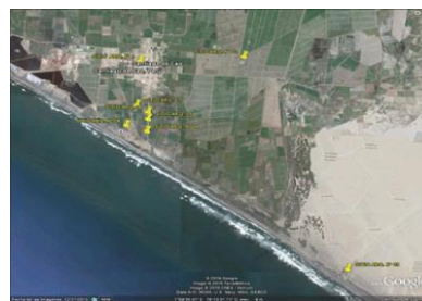
Figura. 1. Vista de los 08 sitios arqueológicos y 03 áreas con biodiversidad, Tomado de google earth (2014).relación significativa.