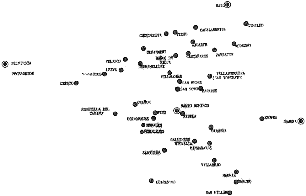
Gráfico 1: Mapa de la comarca