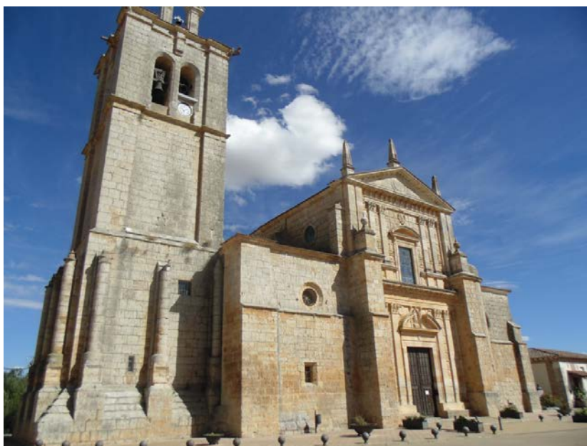
Fig. 3. Iglesia de la Asunción. Fachada principal y torre. Lantadilla (Palencia).