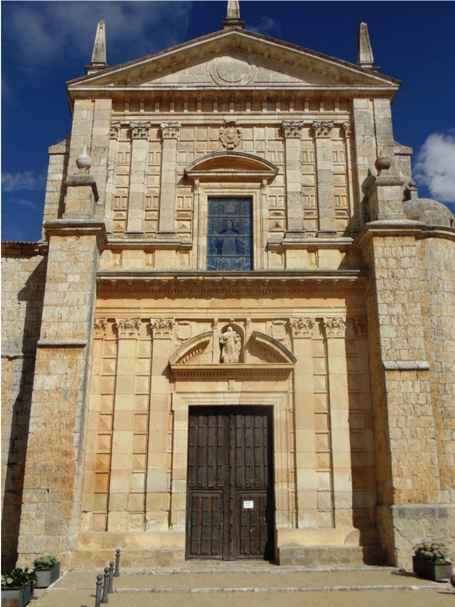
Fig. 4. Fachada principal. Iglesia de la Asunción. Juan Fernández de Bustamante. 1595. Lantadilla (Palencia)

Juan Fernández de Bustamante muestra una alternativa al vitruvianismo impulsado por los arquitectos de la Corte. Explora nuevas vías basándose en Vignola y Serlio, eligiendo de éstos las novedades que se salen de la norma