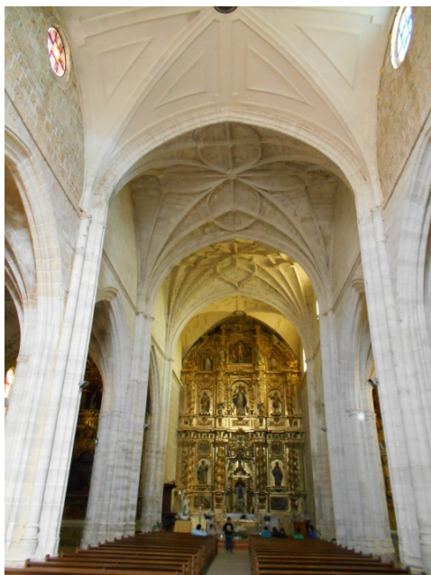
Fig. 1. Interior del templo: nave central. Siglos XV y XVI. Iglesia de la Asunción. Lantadilla (Palencia).