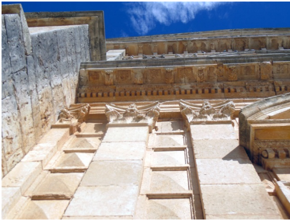
Fig. 8. Detalle del cuerpo superior de la portada. Iglesia de la Asunción. Lantadilla.

La elección de Juan Fernández de Bustamante para el tratamiento del muro de esta fachada que se recubre de un ornamento rústico (fig. 8) se mantiene, una vez más, al margen de Vitruvio. Tomado de una lámina de Serlio (fig. 9) en la que se proponen varios modelos ( Libro IV , capítulo V), encontramos la descripción teórica de lo que vemos labrado en la piedra: el primer tipo con sillares labrados “gruesamente” (sin desbastar), con juntas “subtiles y delicadas”; y “despues con alguna mas delicadeza dividieron los quadros o sellares con una cuerda mas honda que ellos”; a ello se añadía “labrarlos mas polidamente” y también en forma de “cruces por arista”; también “quiriendo ymitar diamantes labrados” y el tipo de “forma de diamantes de tabla llanos”, y “comunmente se llama esta sellareria Punta de diamante”. 74