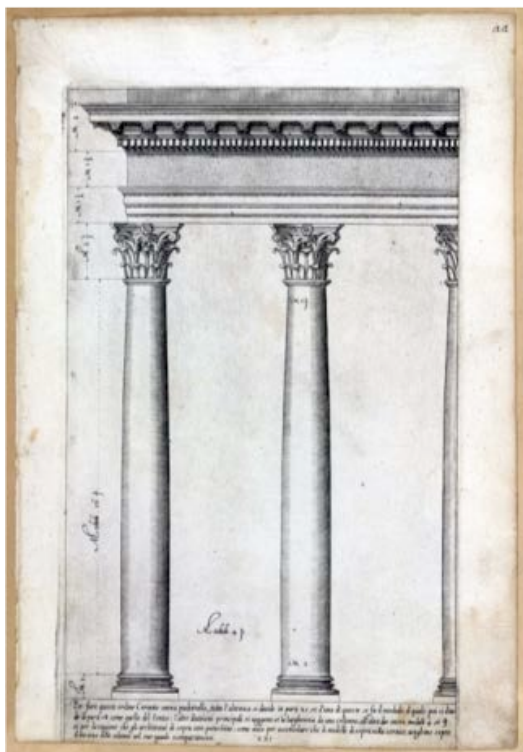
Fig. 5. Modelo de orden corintio. Regola delli cinque ordini d'architettura , lám. XXI. Jacopo Barozzi da Vignola. Ed. princeps. Roma, 1562. Ejemplar conservado en la Biblioteca Nazionale Centrale. Roma.

láminas del orden corintio (láminas XXI a XXIII), donde además el friso aparece liso (fig. 5); pero en la lámina XXVI, con detalle del capitel y entablamento, además de que el friso aparece decorado, lo que le separa de Lantadilla, se representa el sofíto, con recuadros con rosetas, lo que permitirá reflejarlo, con algunas diferencias, en Lantadilla. Así pues, Juan Fernández de Bustamante hace caso omiso a las advertencias de Vitruvio y de Serlio, y en cambio ha acudido a Vignola, donde además encontraba la decoración del sofíto.