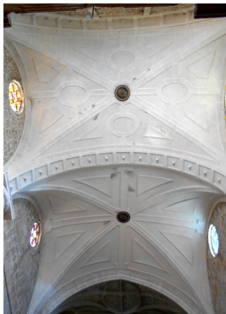
Fig. 2. Bóvedas de los tramos de los pies. Taller de Lanestosa, con modificaciones en el siglo XVIII.

Es difícil precisar la época de construcción de la torre de la iglesia, adosada a la fachada principal (fig. 3) y cuyo diseño se ha supuesto de Juan de Escalante. 39 En su primer cuerpo se disponen columnas y retropilastras, siguiendo en ello a Alberti, con los grabados de la edición de Cosimo Bartoli ( L'Architettura di Leon Batista Alberti , Venezia, Francesco Franceschi, 1565), reproducidos en Los Diez Libros de Architectura de Leon Baptista Alberto. Traduzidos de Latin en Romance (Madrid, Alonso Gómez, 1582). Hace referencia al Libro Sexto, capítulo XII, pp. 185-186, donde describe Alberti varias maneras de relacionar la columna con el muro, aunque aquí se opta por situar las columnas por delante de pilastras. En el siguiente capítulo Alberti dice que “en toda la arte de edificar ciertamente el principal ornamento esta en las columnas, porque muchas puestas juntamente adornan el portal, la pared y todo genero de abertura”, lo que coincide con la valoración de la columna en la base de la torre, la cual ha de ser posterior a 1565, fecha de la publicación de los grabados de Alberti en Italia. Descartamos la opción de que dependa de la edición española de 1582, puesto que no consta ninguna mención a la obra de la torre en la fase constructiva del taller de Lanestosa recogida en el libro de fábrica.