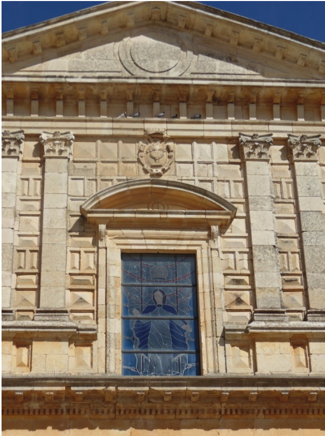
Fig. 7. Fachada principal. Detalle del cuerpo superior de la portada. Iglesia de la Asunción. Lantadilla (Palencia).

posero sopra tutti quest'opera Composita, che così è detta da tutti, benche per quanto si vede, i capitelli sono Corinthii... Ma ponendo i Modiglioni nel Fregio, veniva a far l'opera rica. 70