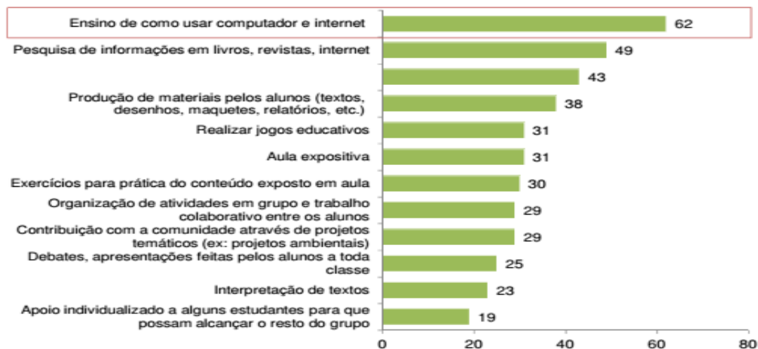
Gráfico 2: : Uso do computador e Internet nas atividades realizadas com os alunos. Percentual sobre o total de professores de escolas públicas que costumam realizar atividade