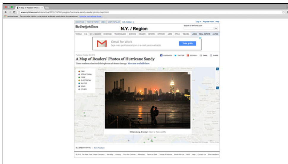
Figura 2 – Manhattan in the background partially without power

ellos con documentación audiovisual, lo que permitió comparar diferentes noticias sobre el tema y la publicación segura por los medios tradicionales. Sin embargo, fue una posible superación para algunos periodistas, especialmente los que estaban acostumbrados a esta nueva realidad mediática y social, donde la noticia circula entre la gente y los periodistas asumen el papel de descubrirla y entenderla.