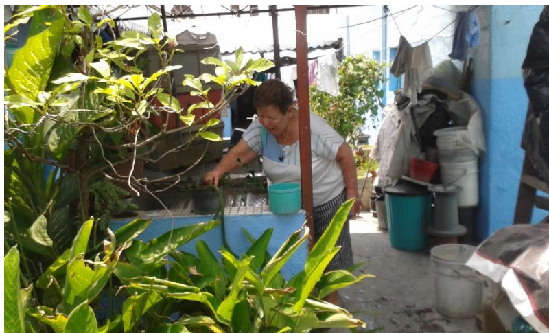
Figura 3. El huerto urbano zoque dentro del hogar

El huerto familiar zoque requiere de un cuidado constante. Los zoques recomiendan que esta actividad se lleve a cabo por la mañana o bien por la tarde, dependiendo de los horarios de trabajo. Si bien el cuidado de las plantas es una actividad que recae en las mujeres, es común que los hombres también participen en el cuidado del huerto.