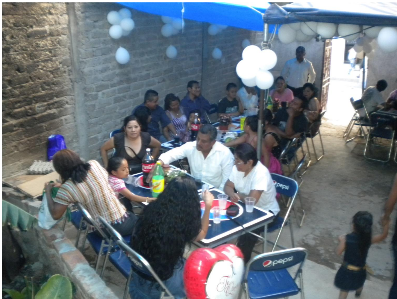
Figura 5. Las fiestas zoques un espacio para fortalecer los lazos familiares y paisanales