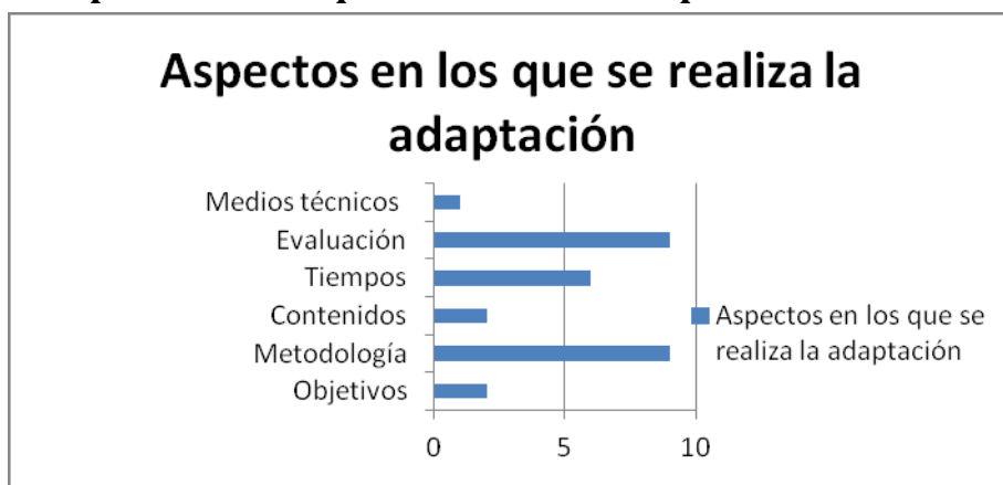
Gráfico 2: Aspectos en los que se realiza la adaptación