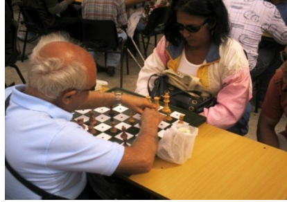
Los espacios públicos en función de los discapacitados (dominó y ajedrez)