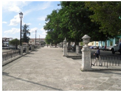
Alameda de Paula