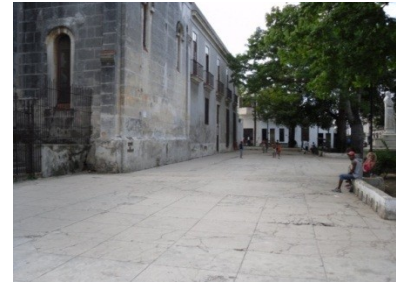
Parque Jesús María