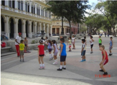
Paseo de José Martí