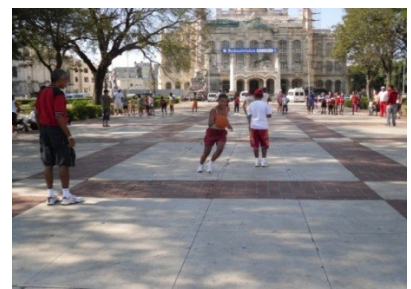
Parque 13 de Marzo