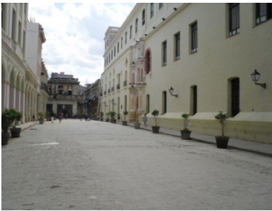
Plazoleta de Belén