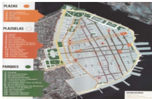
Grafica # 2 Distribución de los espacios públicos del Centro Histórico.