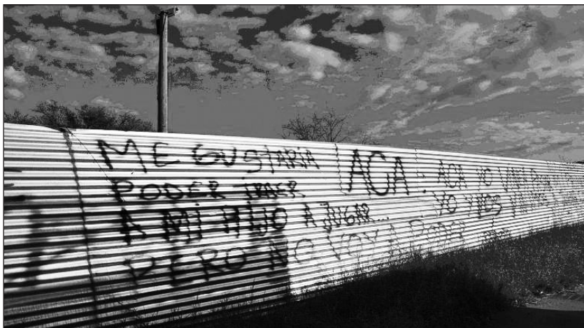
Intervenciones 2011-2012.

La matriz identitaria básica la conformaron los jóvenes quienes enfrentaron el desafío de tomar posición frente a la situación y proyectar modos de transformarlo y transformarse en él. Estos supuestos fueron el sustento