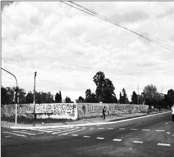
Vista del Parque desde el boulevard de Av. Belgrano.