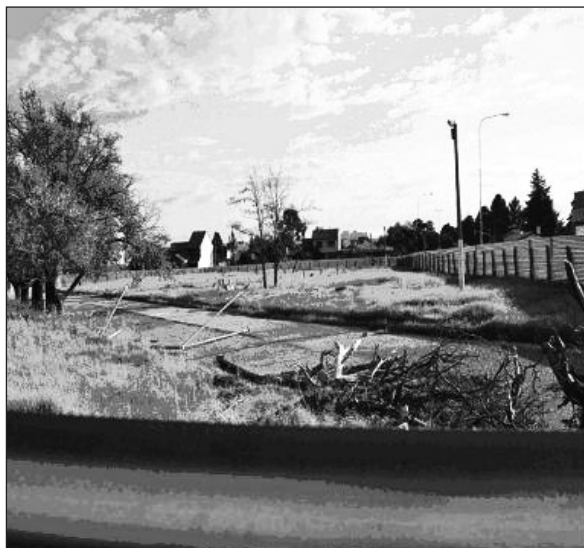
Vista del interior del Parque; a la derecha las ventanas del Colegio Manuel Belgrano.

La importancia remarcada de la subjetividad en la consideración de la acción colectiva se une, decididamente, a la voluntad de emancipación de los sujetos de la acción. Por eso, esta protesta no se la puede desvincular a la constitución misma de los sujetos y la subjetividad. La extensión o los límites de la ciudadanía alcanzan a la definición de quiénes somos y el sentido de nuestra vida. La disputa por ampliar o instituir la ciudadanía se encuentra en el corazón de la protesta (Schuster, op.cit. ).