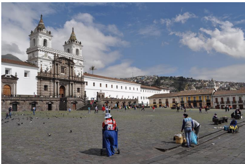
Figura 12: Explanada de la Plaza de la Iglesia de San Francisco de Quito

En este sentido, el Atrio merece especial atención, más allá del justo interés estético que ha despertado entre los historiadores del arte. En él se ha detectado la presencia de una estructura espacial típica del siglo XVI, se trata de una capilla abierta e integrada a éste, que funcionaba como nave al aire libre y de forma provisional, y servía para que el altar y el oficiante estén protegidos mientras los feligreses permanecían en el exterior (Mercé y Gallegos, 2011, p.60).