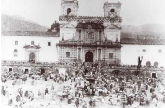
Figura 9 (izquierda): El Tiánguez- Plaza San Francisco 1903 de Andrew Howe.