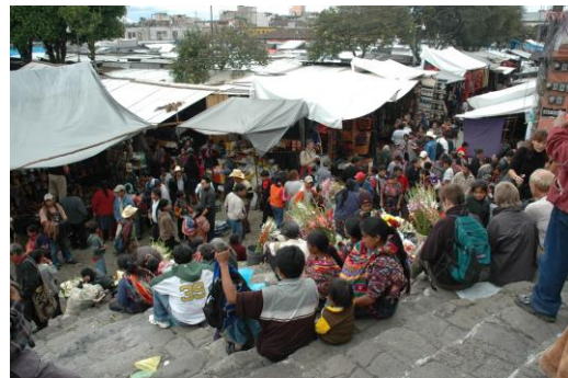
Figura 5 (izquierda): Mercado dominical en Písaq