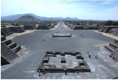
Figura 7 (izquierda): Calzada de los Muertos. Teotihuacán