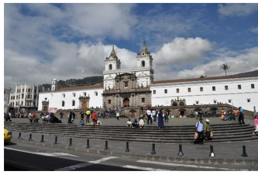
Figura 11 Plaza de San Francisco de Quito.

Por otra parte, la instalación en los mismos centros urbanos precolombinos implicó que muchas veces se operó el proceso de aculturación que fue característico en la conquista y colonización hispanas; las nuevas construcciones se instalaron sobre las antiguas, el ejemplo más paradigmático es la Catedral de Ciudad de México sobre las ruinas de Tenochtitlan y la Iglesia de Santo Domingo en el Cuzco sobre el Altar del Coricancha. Aun así, hubo casos en donde se tuvo que aceptar la convivencia de las antiguas costumbres indígenas con las recién instaladas y uno de ellos es el conjunto de la plaza de San Francisco de Quito (fig. 9, 10 y 11).