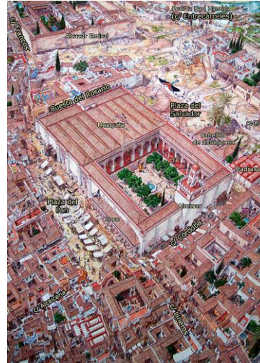
Figura 1 (izquierda): Modelo de la ciudad islámica tradicional con la mezquita en su centro (1) y el zoco (3) en su costado