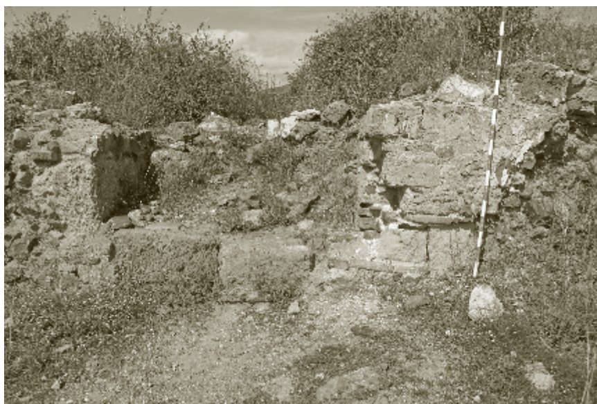
Figura 5. Puerta principal del castillo califal de Bezmiliana