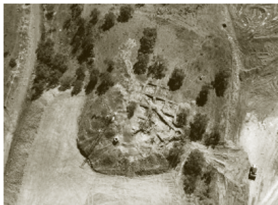
Figura 10. Vista aérea de la fortaleza cristiana construida en la mezquita mayor

lo que era el alminar de la mezquita aljama, ahora consagrada como Iglesia de Nuestra Señora Santa María de la Encarnación de los Remedios 58 . Este baluarte fue una recomendación del bachiller Serrano a los Reyes Católicos para defender a la veintena de nuevos vecinos debido a la lejanía del pueblo de la fortaleza y su carencia de agua 59 . Se trata de dos muros de mampostería y una pequeña torre adosada a la base del antiguo alminar que cierra un espacio interior con un suelo de guijarros (Figura 10). Inicialmente, parece que se emprendieron pequeñas reformas en la antigua fortaleza, sobre todo con la construcción de una pequeña barbacana en el frente sur de la misma 60 , pero la lejanía de esta del centro urbano, hizo que se abordara este tipo de obra 61 .