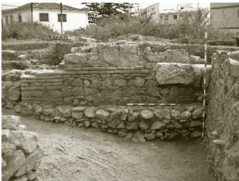
Figura 11. Muro posiblemente de una de las ventas que jalonaban el Camino de Vélez

En cuanto a la ciudad, se constata la reocupación de espacios domésticos en este momento, con fechas de abandonos muy tempranos como bien sabemos por el fracaso de la repoblación 62 . Igualmente, se ha documentado algún muro que podría estar asociado a lo que, una vez abandonado por completo el asentamiento, se llamarían las Ventas de Bezmiliana 63 (Figura 11).