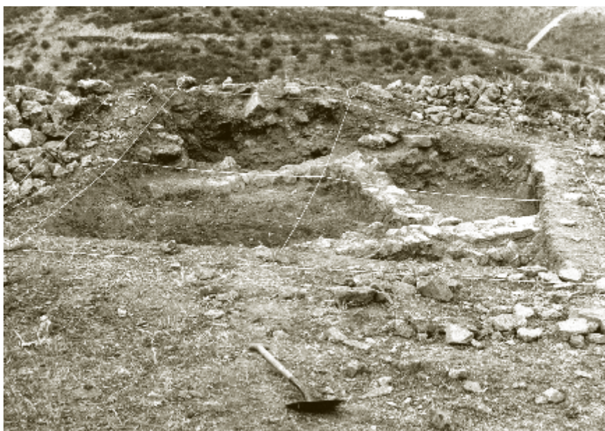
Figura 2. Sondeo realizado por Manuel Acién Almansa en 1978 en la zona oeste de la fortificación de Bezmiliana

Como trabajo de referencia, debemos señalar el realizado por el profesor López de Coca, que basándose en los repartimientos de Bezmiliana, hace un detallado estudio del despoblado a finales del siglo XV 10 , dándonos una visión bastante clara de cómo sería la villa en los últimos años de época nazarí y en los primeros momentos de su ocupación por los nuevos pobladores cristianos.