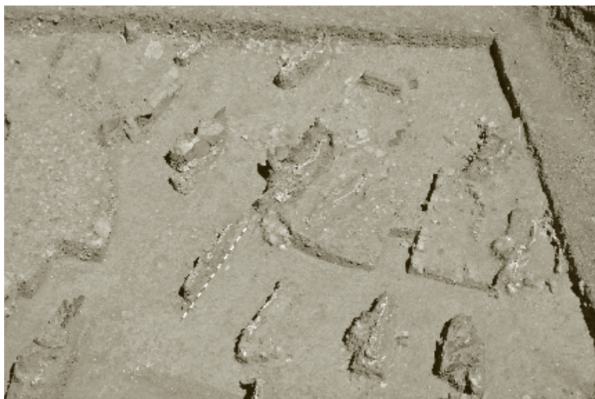
Figura 6. Tumbas del nuevo cementerio de Bezmiliana a partir del siglo X

centurias. Tradicionalmente se ha ubicado este embarcadero en las playas que hay justo enfrente del yacimiento, sin embargo, en la segunda cita de los Anales Palatinos se dice claramente que está ubicado al este de la alquería de Bizilyana. Pienso que esta segunda referencia es más exacta