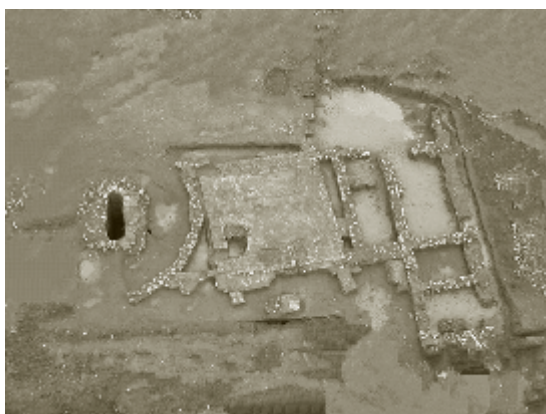
Figura 7. Vista de la alberca y dependencias auxiliares del siglo X

arrastres quedaban enganchados a ella frente a lo que actualmente es el cuartel de la Guardia Civil.