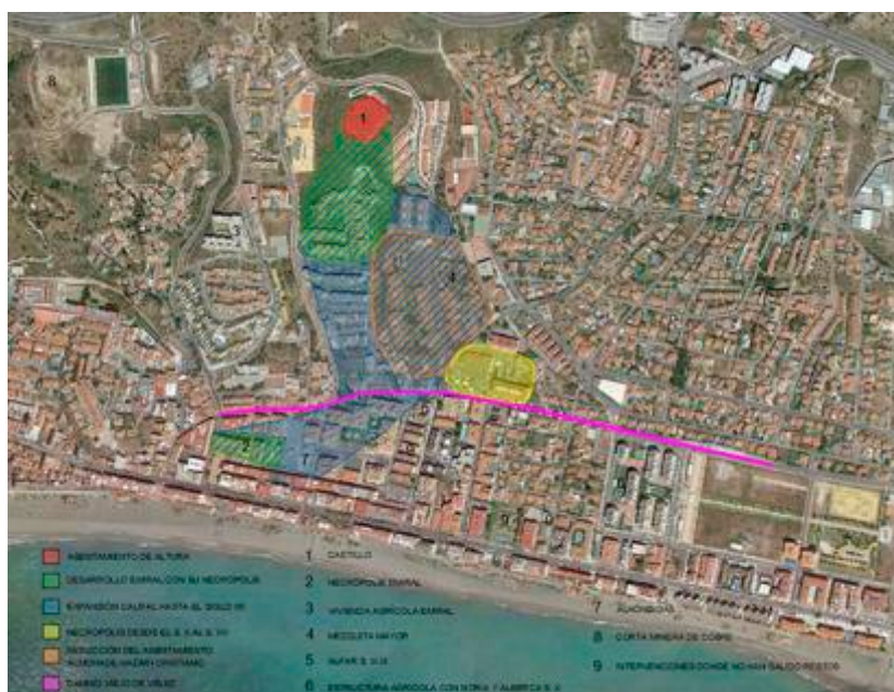
Figura 12. Plano de evolución de Bezmiliana

en el que, debido a su falta de seguridad, es abandonada por completo a mediados del siglo XV.