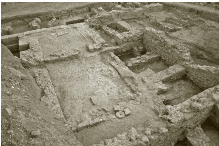
Figura 3. Vista del edificio romano excavado en 2005 en lo que después sería la segunda necrópolis de Bezmiliana

tarde se construiría el hins , estableciéndose las primeras viviendas en las zonas inmediatas al mismo. Así se puede ver en las excavaciones llevadas a cabo en 1997 40 , donde se documenta un entramado de viviendas con patios, datadas gracias al gran conjunto de cerámicas a torno lento en el siglo IX y abandonadas en el siglo XI.