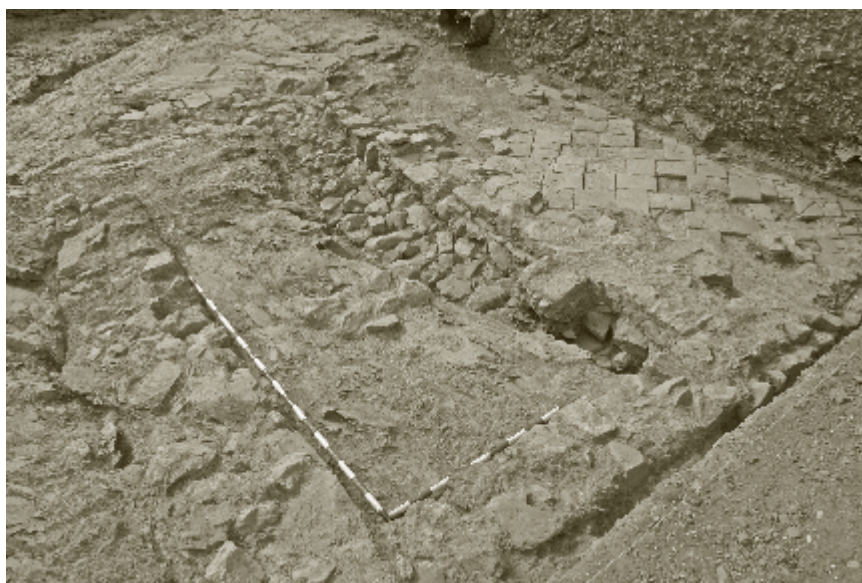
Figura 8. Vista de parte de una vivienda nazarí, abandonada en época cristiana

Aunque la arqueología aún no ha constatado la existencia de la misma, lo que sí está claro es que esta estaría en tan malas condiciones que, ante la imposibilidad de repararla, provocó que los últimos pobladores nazaríes y posteriormente los primeros ocupantes cristianos, abandonaran la población para buscar refugio en ciudades más seguras como Málaga o Vélez 53 .