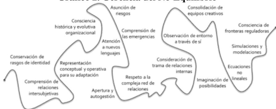
Gráfico 2. Gerencia del No-Equilibrio

vínculos, modelos, informaciones, procesos y productos) con la intención del cambio de formas, estructuras y procesos según las necesidades del momento, pero manteniendo su identidad.