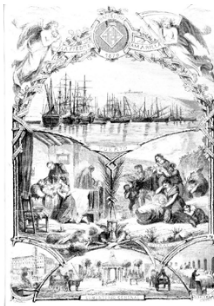
Fig. 2. La Ilustración española y americana , 25/11/1870, p. 430, detalle

Diez días después, en la misma publicación, se presenta la imagen más conocida de la fiebre amarilla junto a su artículo explicativo (fig. 2). 20 Lo visual y lo textual se complementan. La descripción de la enfermedad, las actitudes de los políticos y de los fabricantes, la evacuación de los ciudadanos y la apertura del sistema asistencial hospitalario, dan un enfoque épico a como las autoridades han manejado la epidemia de 1870. En el grabado de Padró y Capuz, filacterias nos aportan las leyendas de las diferentes secciones del mismo a página entera: «PUERTO», «LA MUERTE», «EMIGRACIÓN», «HOSPITAL PROVISIONAL», «CEMENTERIO GENERAL» y «HOSPITAL». Otras inscripciones nos remiten a los personajes y entidades que formaron parte de la lucha contra la epidemia. El ángel protector y el ángel con la guadaña dominan la parte superior y se ciernen sobre el puerto de la ciudad que deja paso a la muerte y a la emigración. La asistencia a los enfermos en sus lechos de muerte se opone a las familias que huyen hacia el interior alejándose de la franja marítima. En la ciudad, la asistencia en los hospitales se completa con la que ofrecen los provisionales. Aun así, no pueden hacer frente a las elevadas tasas de mortalidad que conducen inexorablemente al cementerio. Abre este su entrada principal a los féretros y carruajes en la parte inferior del grabado.