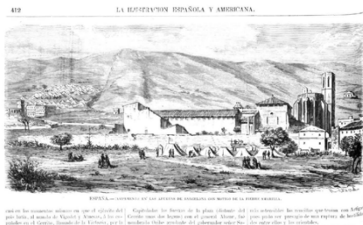
Fig. 1. La Ilustración española y americana , 15/11/1870, p. 412, detalle

Los periódicos han referido las tristes causas que han dado lugar al desarrollo de la fiebre amarilla en Barcelona. La Barceloneta, ó sea el arrabal de la marina, ha sido desde el primer momento cruelmente castigado por tan terrible azote. (...) Los habitantes de la Barceloneta abandonan sus hogares para refugiarse en la ciudad. La escena es desoladora, y constituye, por decirlo así, el principio de las calamidades que pesan sobre la capital del Principado (...). 17