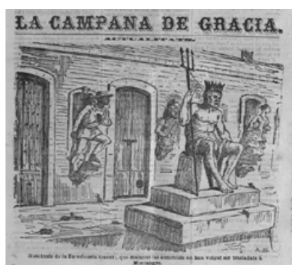
Fig. 6. La Campana de Gracia , 30/10/1870, p. 1, detalle