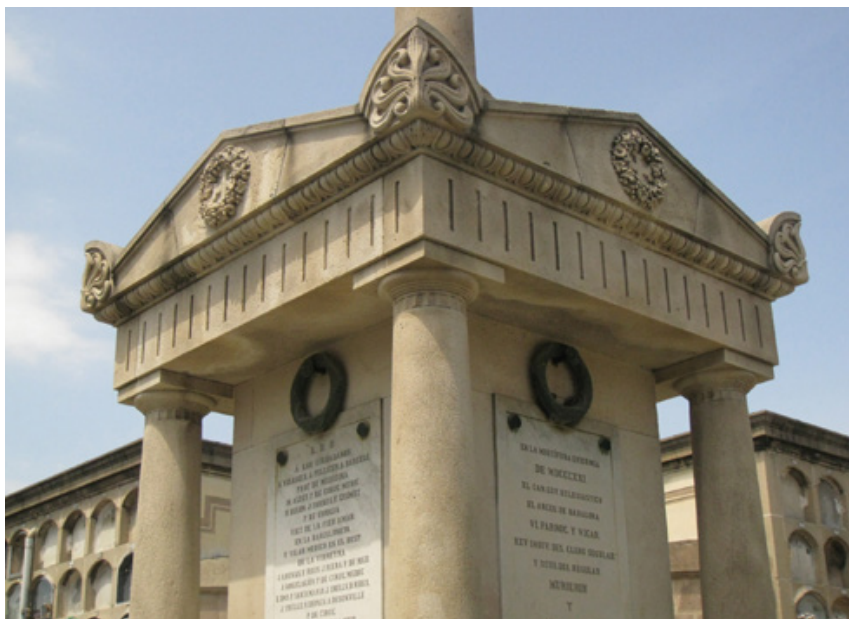
Fig. 8. A las víctimas de la epidemia de fiebre amarilla de 1821 . Cementerio de Poblenou, Barcelona, detalle.

lo sitúan en 1852 como proyecto municipal para ser instalado ante la fachada principal de la casa consistorial de Barcelona en la calle Ciutat, obra de Francesc Daniel Molina (1812-1867), realizado finalmente en el camposanto. 36 El monumento cívico A las víctimas de la fiebre amarilla de 1821 , elaborado en mármol blanco, presenta un estilo clásico rematado por una columna con una cruz en lo alto. En los cuatro lados del cenotafio se encuentran placas conmemorativas, una en recuerdo de las víctimas, otra en memoria de los concejales del Ayuntamiento muertos por la misma causa, y dos dedicadas a los colectivos que más se involucraron en la lucha contra la epidemia, los médicos y los eclesiásticos. 37 La reminiscencia de los traspasados en la epidemia se convierte