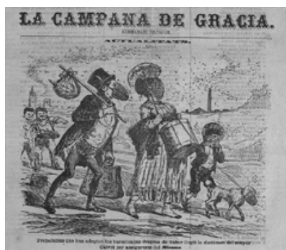
Fig. 4. La Campana de Gracia , 09/10/1870, p. 1, detalle