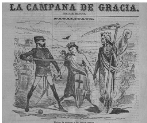
Fig. 3. La Campana de Gracia , 02/10/1870, p. 1, detalle

celona, como alegoría femenina con el escudo de la ciudad, se debate entre los cañones y la guadaña de la muerte. En la cuarta página del semanario se muestran los Datos de la fiebre amarilla recogiendo la mortalidad acaecida en Cádiz (1800 y 1804) y Barcelona (1821) y deseando ante el nuevo crecimiento de la población «que hoy la misma enfermedad no causará tantos estragos. ¡Ojalá no nos equivoquemos!». 25 El artículo precisa, además, las medidas tomadas, como la cuarentena y fumigación para los que salen de la ciudad y la habilitación de la plaza de toros de Valencia para controlar a los pasajeros llegados a la estación, procedentes de Barcelona.