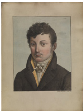
Fig. 9. Étienne Pariset y André Mazet: Observations sur la fièvre jaune, faites à Cadix , en 1819, Audot, París, 1820.