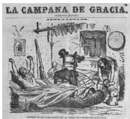
Fig.5. La Campana de Gracia , 23/10/1870, p. 1, detalle