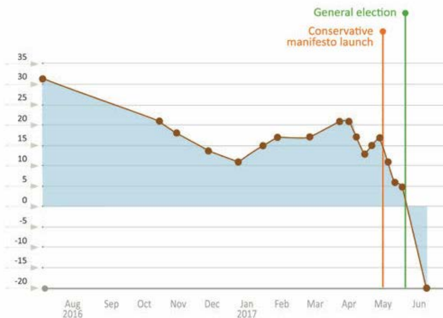
Gráfico 3: que muestra la popularidad de la primera ministra Theresa May, con un visible derrumbe tras las elecciones