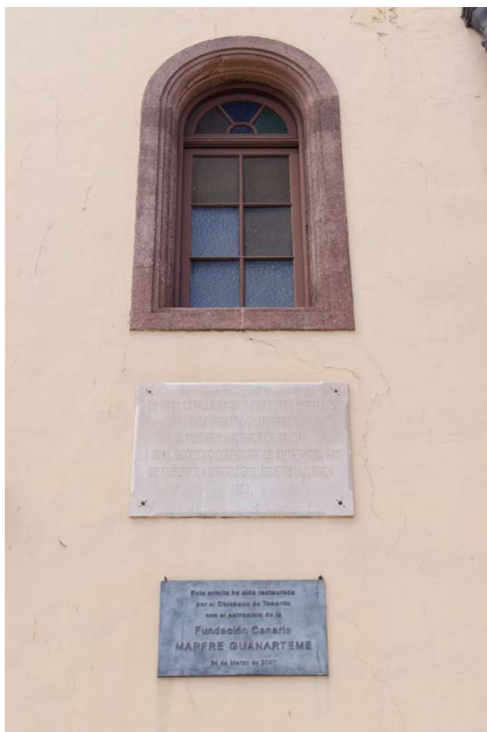
Ermita de San Cristóbal. Situada en la plaza del mismo nombre, también conocida como Plaza de la Milagrosa. Erigida por advocación a uno de los santos patrones de la ciudad, esta ermita se fundó en los primeros años del siglo XVI en una propiedad particular. La fábrica actual posiblemente es del siglo XVIII. La tradición histórica señala que los restos de Fernando Guanarteme de Gáldar, que luchó a favor de Fernández de Lugo y frente a las huestes aborígenes de Tenerife, yacen en su recinto.