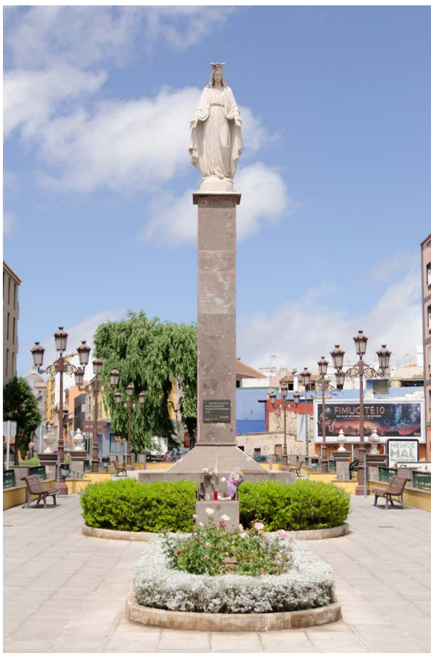
Virgen de la Milagrosa. Situada en la Plaza de San Cristóbal, también conocida como Plaza de la Milagrosa.

Situada a 550 metros sobre el nivel del mar, la ciudad de San Cristóbal de La Laguna, en la isla de Tenerife, ha sido testigo de los primitivos asentamientos guanches y la posterior colonización europea. El sitio de La Laguna, otrora sede de la Capitanía General de Canarias (1656-1723) y capital del archipiélago (hasta 1883), reúne en sus calles casas de tradición histórica, palacios, iglesias y templos de incalculable valor histórico y cultural.