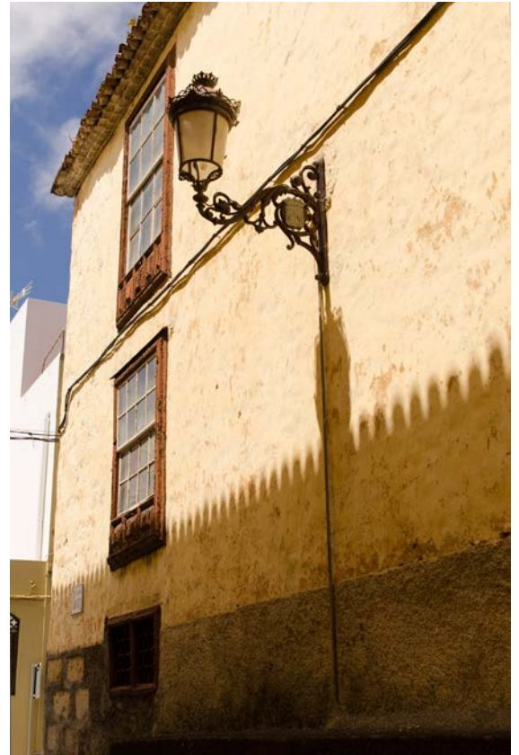
Vista del histórico callejón de la Amargura.