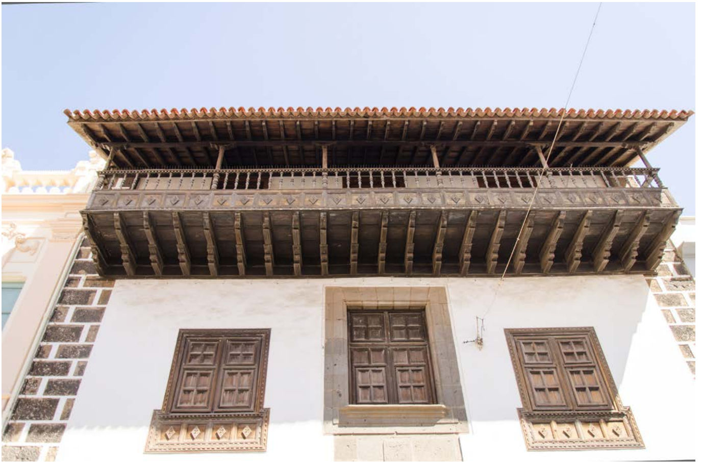
Casa Bigot (s. XVII). El balcón de madera sobresaliente es un elemento característico de la arquitectura tradicional canaria.