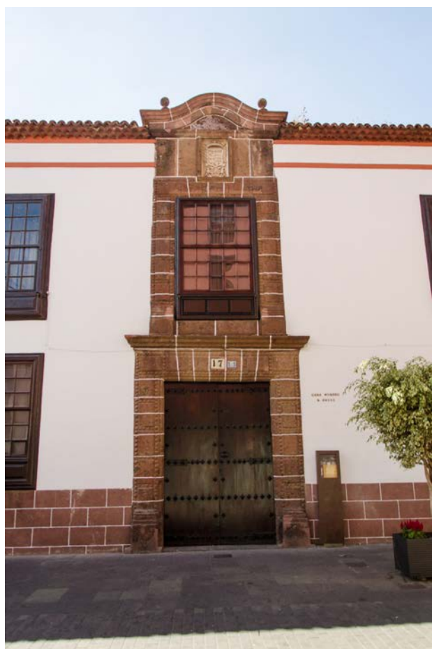
Casa Riquel. Edificación del siglo XVIII, mandada a construir por Antonio Riquel de Angulo. De su fachada destaca la portada principal de cantería roja, que incluye el escudo de armas de la familia. Se trata de una construcción de importante interés patrimonial.