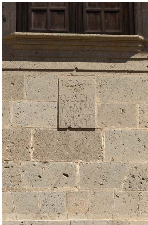
Casa Bigot (s. XVII). Detalle de placa inscrita en piedra.