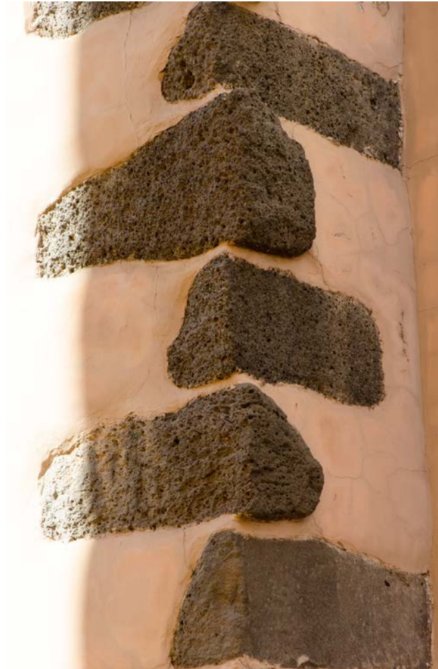
Detalle de construcción. La piedra es un elemento fundamental en la arquitectura tradicional canaria.