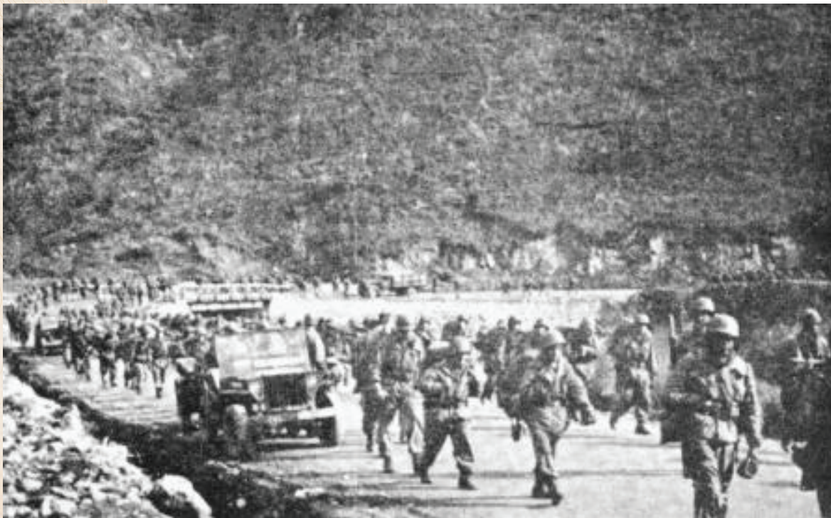
El Batallón Colombia se desplaza a la batalla de Old Baldy en Corea