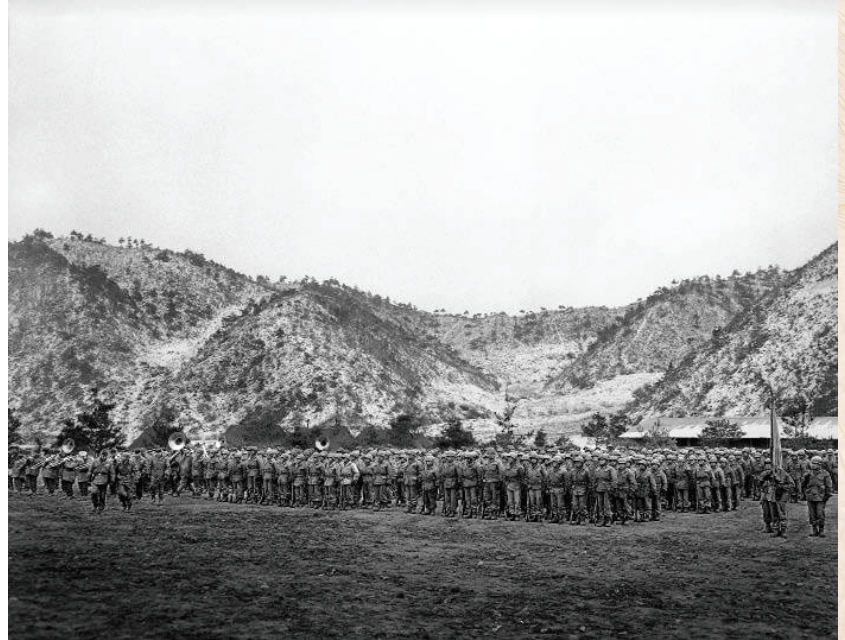
Batallón Colombia n.º 1 en formación en Corea