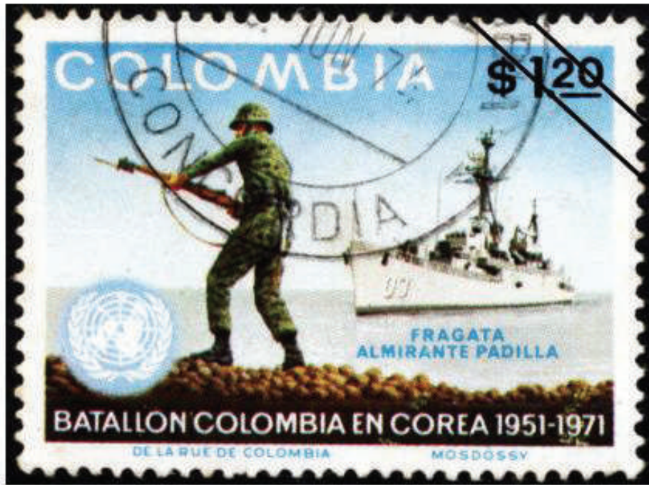
1972 20 años "Batallón Colombia en Corea 1951-1971", por un valor de $1.20.

Estampilla conmemorativa de los 20 años del Batallón Colombia en Corea 1951 -1971