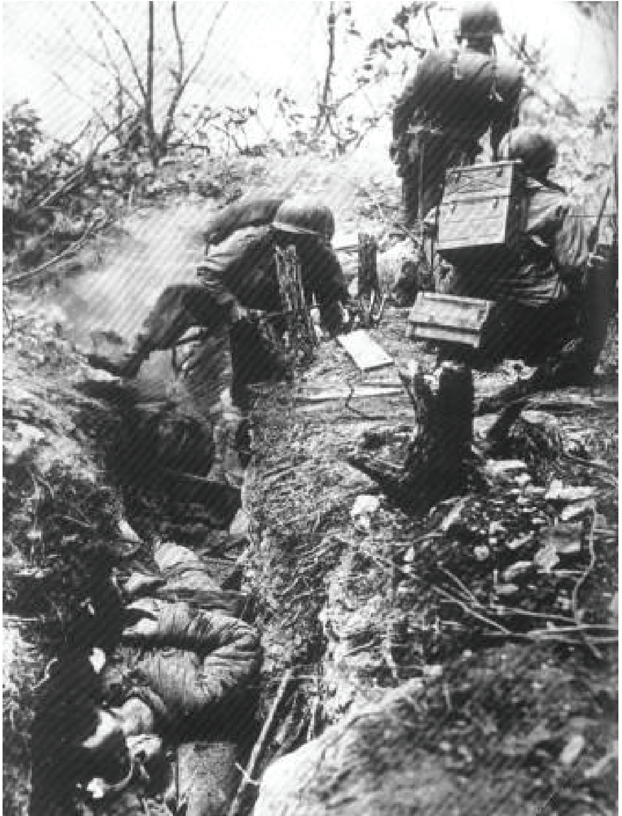
Soldados del Batallón Colombia en el asalto a Chamizo -Corea