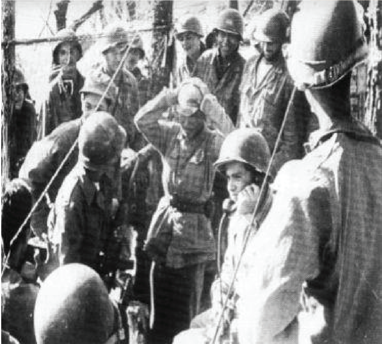
Soldados del Batallón Colombia con un prisionero en Corea