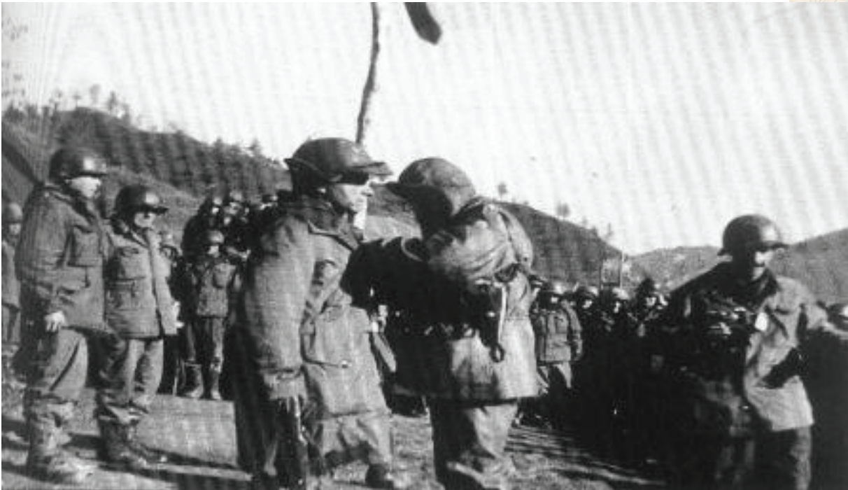
Condecoran soldado colombiano en la guerra de Corea