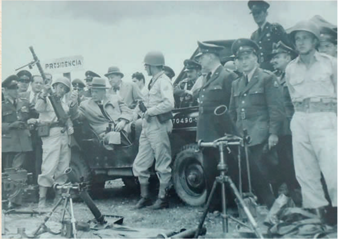
Presidente de Colombia Laureano Gómez inspecciona armas del Batallón Colombia