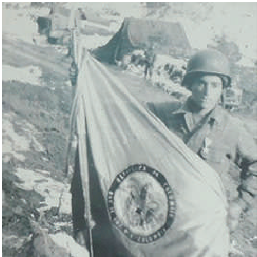
Soldado con la bandera de Colombia en Corea