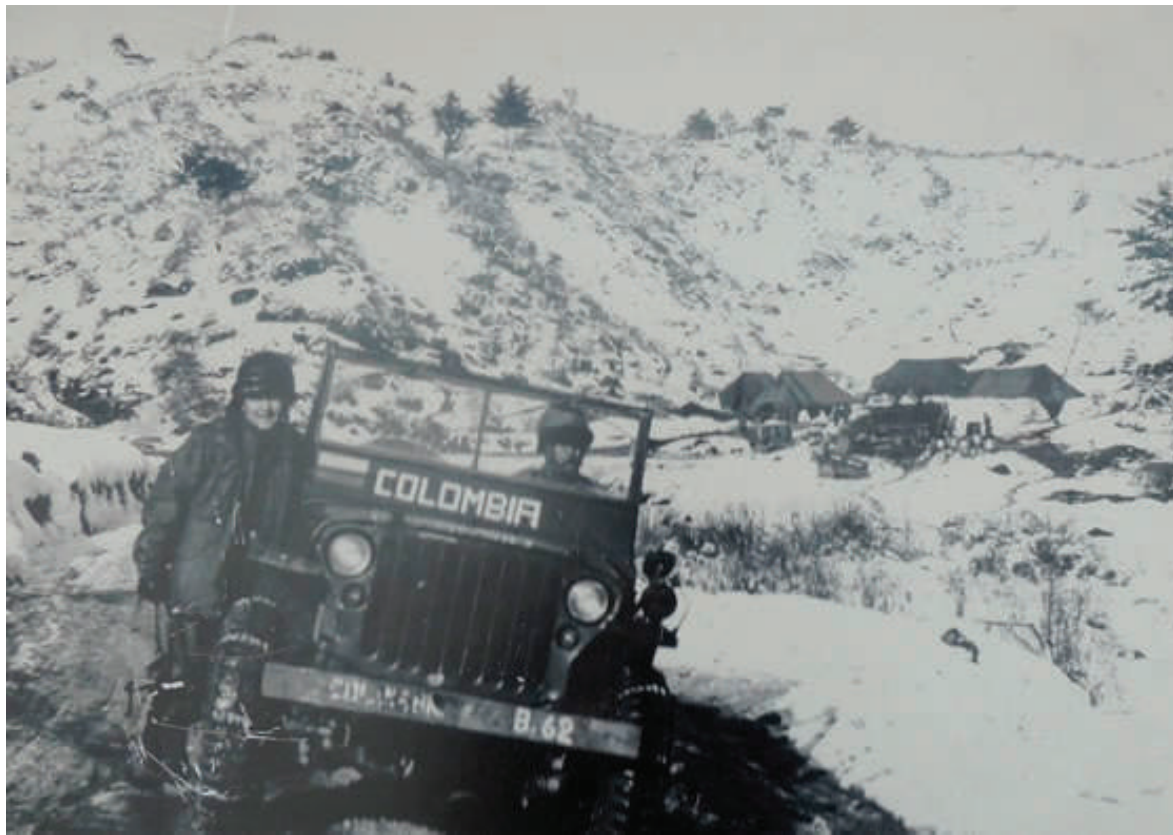
Soldados del Batallón Colombia