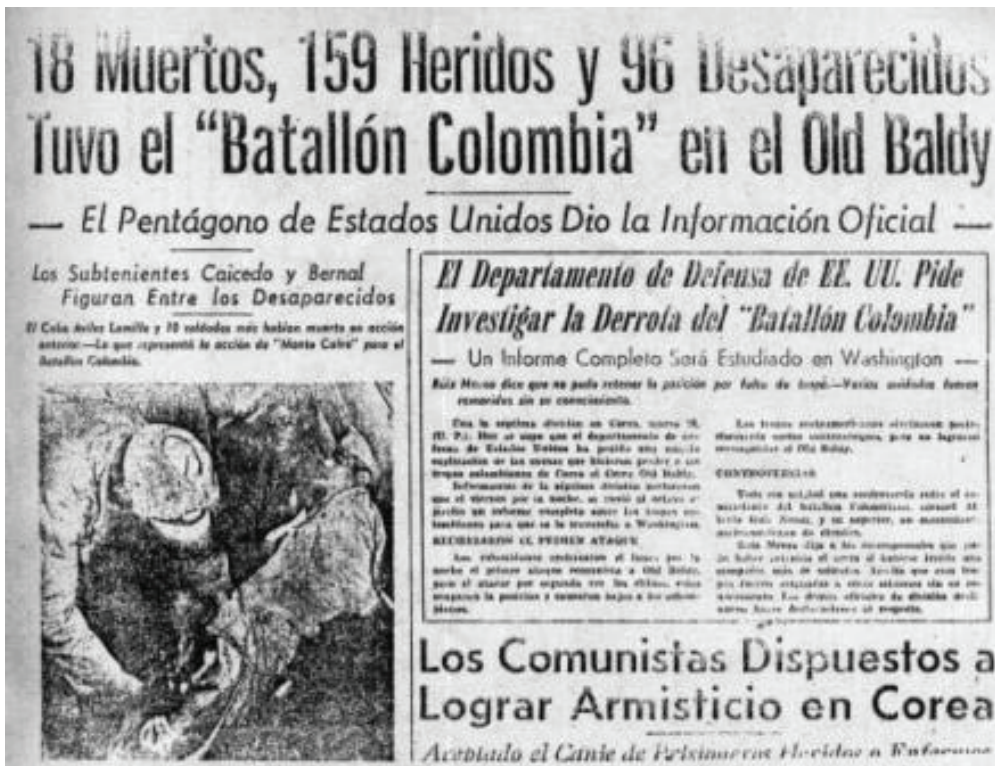
Registro de la cuenta batalla de Old Baldy del Batallón Colombia en Corea