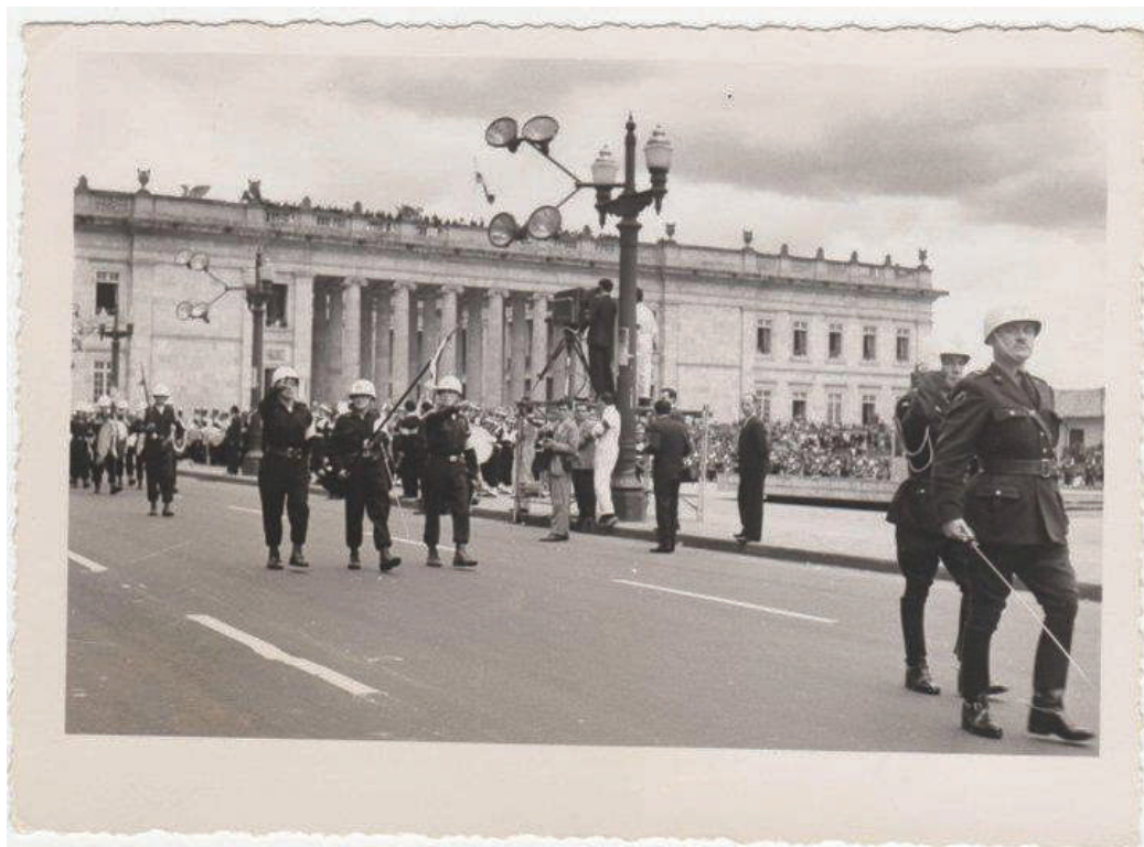
Veteranos de la guerra de Corea en el desfile del 20 de julio