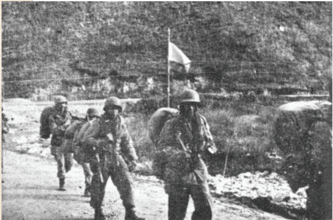
Soldados del Batallón Colombia en Corea