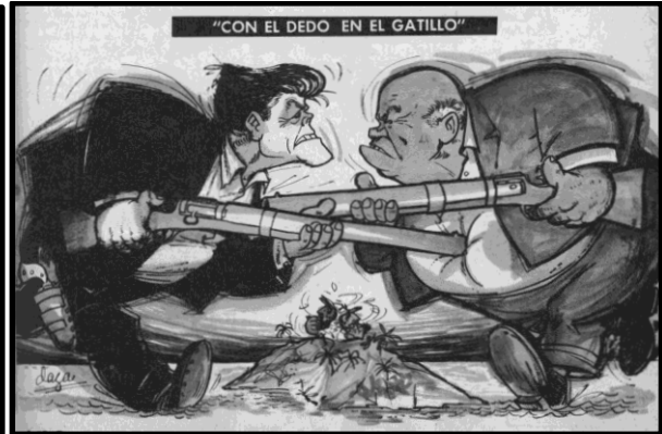
Fig.10. F. Daza, Topaze , 26 de oct. 1962.

La Crisis de los Misiles fue uno de los momentos más retratados de los conflictos de la Guerra Fría en Topaze . El semanario se hizo cargo de presentar explícitamente este incordio prácticamente día por día. Algo interesante es la visión que se presentaba del fin de la crisis, puesto que se tendía a plasmar que Jruschov y el gobierno soviético habían abandonado a Fidel Castro y el gobierno revolucionario de la isla. Ejemplo de esto son las la Fig. 11 y 12. La fig. 11 por un lado, presenta una acción en cuatro cuadros. En la primera se muestra a un pequeño Fidel Castro sobre un bloque que dice “bases rusas” que levanta su puño –al parecer– contra unas piernas que simbolizan al presidente de Estados Unidos. En el segundo cuadro, mantiene su actitud, pero se ven unas manos enlazadas. En el tercer cuadro ambas piernas se retiran y se ve como el pequeño Fidel se va cayendo. Finalmente, en el último cuadro se expresa a Fidel triste y solo, incluso con su habano en el piso. Así, la historieta simboliza que Cuba ha perdido el apoyo estratégico del gobierno soviético. La Fig. 12, “regreso a casa”, muestra a Jruschov y Kennedy alejándose abrazados de Cuba, cada uno cargando sus armas, mientras tanto a la espalda de ambos se presenta a un Fidel Castro semidesnudo con cara de lamento sentado sobre la isla de Cuba.