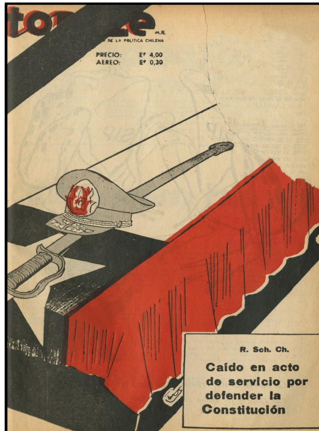
Fig. 1: Topaze , n° 1981, Santiago, 30 de octubre de 1970.

En síntesis, durante la década de 1960 Topaze vivió un momento de inestabilidad y tendió a dejarse influir por algunas corrientes partidistas, o por lo menos así se denunció. En el último número, del 30 de octubre de 1970, hizo una crítica explícita hacia los posibles asesinos del general René Schneider y el rol de este como defensor del orden constitucional 6 : “caído en acto de servicio por defender la constitución” (Fig. 1). Este último número fue prácticamente dibujado sólo por Melitón Herrera (“Click”), lo que da cuenta de la precariedad que había alcanzado la otrora revista de humor político gráfico más longeva e importante de la historia de Chile al tener sólo un dibujante realizando todo el trabajo de un número.