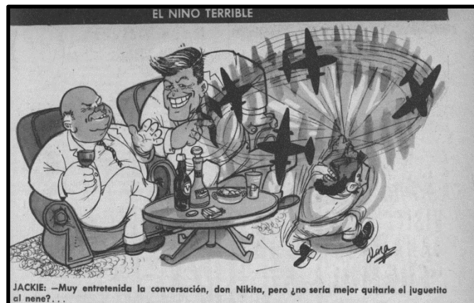
Fig. 8. Fernando Daza, Topaze , 23 de nov. 1962

Las caricaturas de Topaze , buscaron retratar la tensión que se vivía desde el surgimiento del conflicto. En este sentido, los dos personajes que más se encontraron en el foco de atención fueron Castro y Kennedy. La fig. 9 representa a Kennedy tratando de sostener la presión interna que vivía por la opinión pública y contener la presión externa con Fidel Castro y la instalación de los misiles soviéticos en la isla de Cuba. La fig. 10, bajo el título “con el dedo en el gatillo”, presenta a Jruschov y Kennedy apuntándose con unas escopetas mientras que en el centro se encuentra la isla de Cuba y Fidel Castro con un movimiento que pareciese de nerviosismo y preocupación. Este tipo de imágenes se repitió largamente durante estos meses, de hecho, este Affaire internacional será retratado en todos los números del semanario hasta fin del 1962.