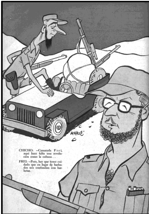
Fig. 4, Alhué, Topaze , 06 de marzo de 1959