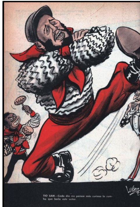
Fig. 6. Lugoze, Topaze , 24 de julio de 1959.

La figura de Fidel Castro comenzó a tomar una notoriedad cada vez más amplia en las revistas de humor político. La consolidación y asentamiento de la Revolución Cubana empoderó el rol que jugó su opinión en el contexto interamericano, lo que propició la visita del presidente estadounidense a Sudamérica en 1960. Las figuras de Castro y Ernesto “Che” Guevara, serían banderas de lucha levantadas en los diversos países de Latinoamérica y Chile no fue la excepción. El segundo momento en que Cuba tomó los principales medios de comunicación fue en el marco de la Crisis de los Misiles en 1962.