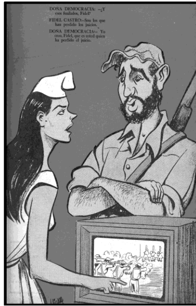
Fig. 3. Vicar, Topaze , 30 de enero de 1959.

La Revolución Cubana tomó la agenda nacional y diversas visiones sobre el proceso cubano fueron cristalizadas en la prensa. En este mismo contexto, se plasmó a los líderes visibles de la oposición al gobierno de Jorge Alessandri, Salvador Allende y Eduardo Frei como “favorables” a la posición de la revolución. En la viñeta realizada por Alhué se ve a Salvador Allende y a Eduardo Frei vestidos con trajes y barbas que emulan al movimiento de los “barbudos” revolucionarios cubanos (Fig. 4). Incluso en la imagen se presenta que Allende comenta: “Camarada Frei, aquí nos hace falta una revolución como la cubana” y Frei responde: “Pero hay que tener cuidado que en lugar de barbudos nos confundan con barbetas”. Por otro lado, la figura 5, un foto montaje, representa a Eduardo Frei –travestido– bajo el seudónimo de Duardita Frei y, a Salvador Allende, con el sobrenombre del “actor” Alejandro Flores Mustias Allende, que según la leyenda de la imagen se encuentra “en el momento más dramático de la obra ‘Esperando a Fidel’”. Esta supuesta “alineación” con el gobierno cubano será constantemente achacada a los miembros del bloque opositor a la administración Alessandri.