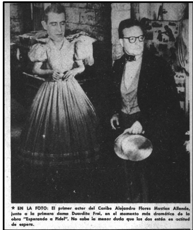
Fig. 5, Topaze , 07 de agosto de 1959

Por otro lado, las sospechas del apoyo soviético al gobierno cubano no se hicieron esperar y de manera más metafórica o más directa se representó la posible injerencia que el gobierno soviético tuvo en la consolidación del triunfo de la Revolución Cubana. Por ejemplo, la ilustración de Lugoze muestra a Fidel Castro bailando al estilo ruso, pero con traje de "rumba" y detrás lo mira el Tío Sam diciendo: "Cada día me parece más curiosa la rumba que baila este señor" (Fig. 6).