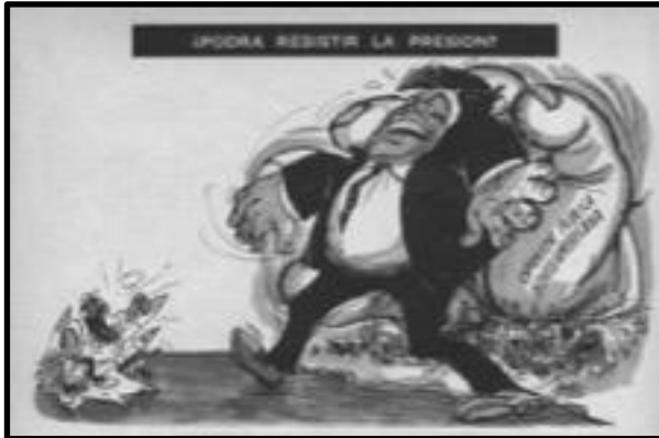
Fig. 9. F. Daza, Topaze , 12 de oct. 1962