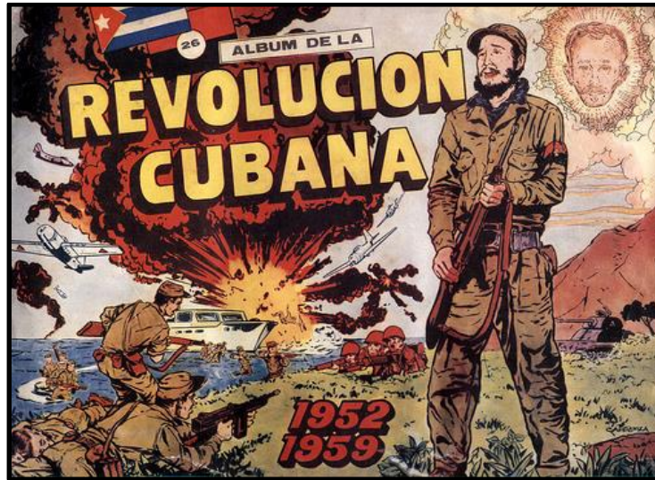
Fig. 2. “Álbum de Revolución Cubana”, Cuba, Revista Cinegráfico , 1960.

El 1 de enero de 1959, Fulgencio Batista, dictador cubano, se asiló en la República Dominicana ante la inminencia de la victoria del bando revolucionario. Este día marca el triunfo del movimiento insurreccional encabezado por Fidel Castro quien será nombrado Primer Ministro el 16 de febrero de ese mismo año. En Topaze , prontamente se generaron reacciones a la llegada del gobierno de Castro. La viñeta de Vicar del 30 de enero de 1959 (Fig. 3) muestra a un joven y triunfante Fidel Castro que conversa con “Doña Democracia”. Esta le pregunta: “¿Y los fusilados, Fidel?” a lo que Fidel responde: “Son los que han perdido los juicios”, replicando nuevamente “Doña Democracia”: “Yo creo Fidel, que es usted quien ha perdido el juicio”. Este diálogo revela la suspicacia y desconfianza con la que se miró – desde Topaze – el proceso de la Revolución Cubana a la luz de los llamados juicios revolucionarios que se gestaron durante los primeros meses del gobierno revolucionario contra los criminales de guerra 10 . Esta es la primera representación dentro de la revista que hace directa alusión al triunfo del proceso revolucionario cubano, tema que se complejizará con el paso de los años.