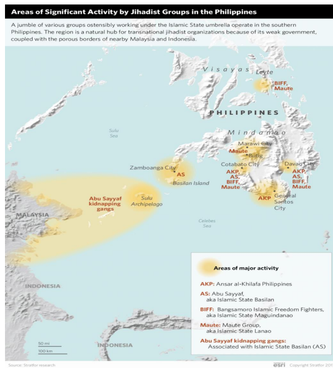
Figura 1. Áreas de actividad significativa de los grupos yihadistas que operan en Filipinas.