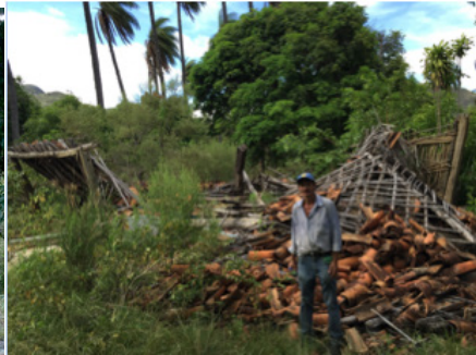
Figura 3 - Destroços da casa de Esmail antes da desapropriação