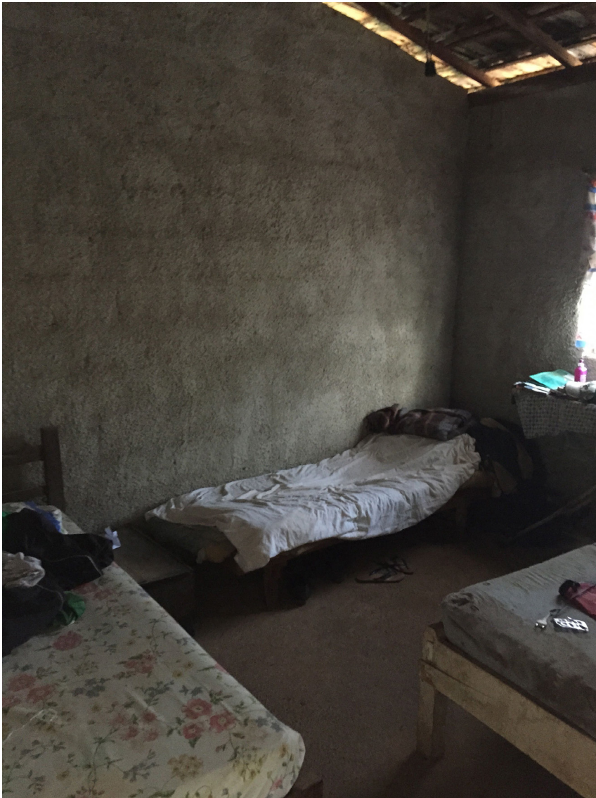
Figuras 4 e 5 - Casa onde residem o Sr. Esmail e seus irmãos (Loteamento Cerrado, Distrito da Serra do Cipó, município de Santana do Riacho)