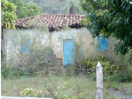
Figura 2 - Foto antiga da casa de Esmail.