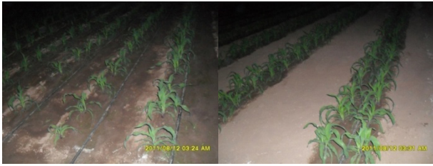
Figura 1. Fotos del campo experimental tomadas de noche, el mismo día que se aplicó el riego; correspondientes al sistema de siembra en surcos simples (izquierda), y surcos pareados (derecha)

En cada sistema de siembra se implementaron parcelas divididas en bloques al azar con dos repeticiones; siendo una de las parcelas el factor A o fuente orgánica de nitrógeno en forma de compost (De Grazia et al. , 2006; Salamanca, 2008) con 3 niveles (0, 5, 10 t/ha); y la otra el factor B o dosis de nitrógeno sintético (Tisdale y Nelson, 1991; Mengel y Kirby, 2000) en forma de urea con 3 niveles (0, 120, 240 kg/ha de nitrógeno). Los tratamientos aplicados en cada sistema de siembra se muestran en la Tabla 2.