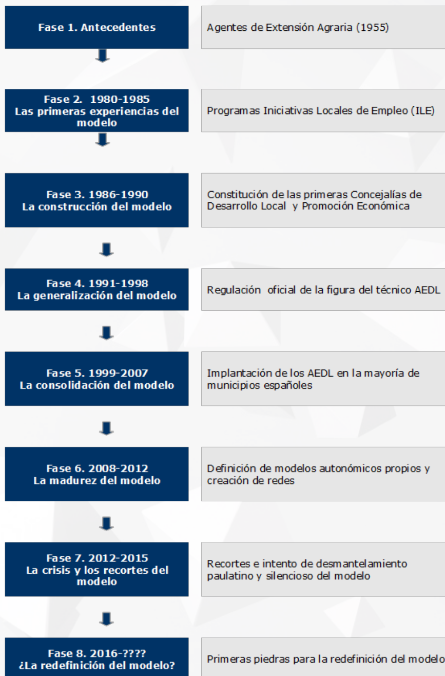
Figura 1. Proceso evolución del modelo de desarrollo local en España