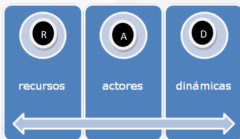
Figura 3. Los elementos esenciales para el desarrollo