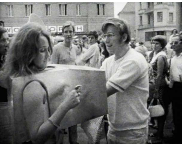
4. Valie export tattoo https://www.pinterest.de/pin/296041375480779315

Weibel, iba animando a los transeúntes a que manipularan el pecho de Export que estaba oculto detrás de una caja con unas cortinas a modo de teatrillo, destrozando la imagen de la mujer como un objeto pasivo y entrando de lleno en el cuestionamiento de conceptos como el de voyeurismo o el exhibicionismo. En el acto, rememora esa violencia primordial del hombre con relación a la mujer. Además, el antecedente cinematográfico dentro de la vanguardia surrealista es aludido en el caso de ciertas escenas de "Perro Andaluz" de Buñuel/Dalí. En ambas obras ella transformó la situación voyeurística del cine en un "cine ampliado", sustituyendo la imagen cinematográfica de la "feminidad sexual" definida por los hombres por su propio cuerpo real y devolviendo la mirada a los que la observaban, desafiando la misogamia prevalente de los hombres puestos bajo la mirada.