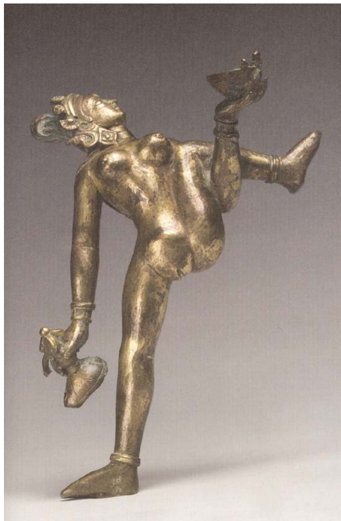
9. Autor Eugenio Mangia- 1990

Export, con gran audacia y cierto sentido del humor e ironía busca, demostrar el sin sentido