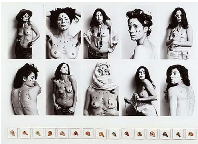
1. Hanna Wilke: