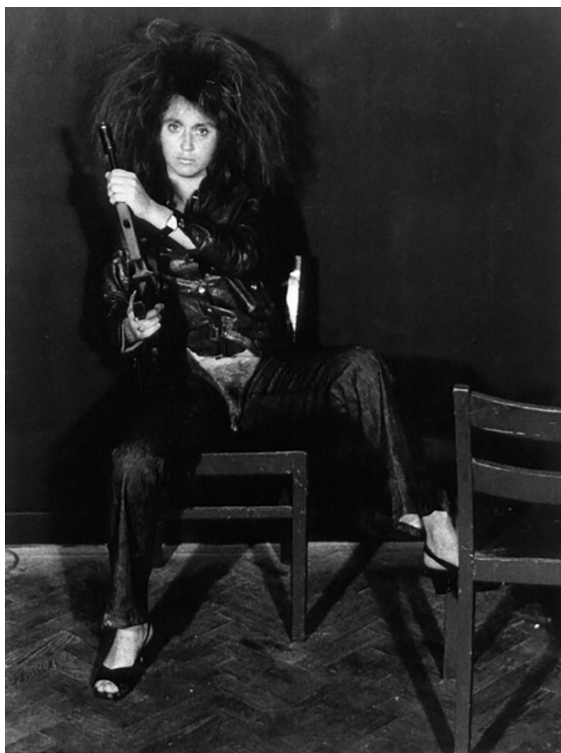
3. valie-export-action-pants- http://shybridutterance.wordpress.com/2009/10/01/action-pants-1969-valie-export

que habían acudido a la sala buscando otro tipo de espectáculo, amenazados tanto física como psicológicamente por el arma y por el "cambio ontológico" de una imagen pornográfica femenina en celuloide a los genitales femeninos reales, los espectadores abandonaron la sala de cine. "Esta acción es una metáfora sobre el discurso feminista de autoafirmación de la diferencia con evidentes referencias críticas a la teoría freudiana sobre el "complejo de castración". Blandiendo el símbolo fálico del arma destructiva, Valie Export asumía un rol activo y de verdadero poder, mostrando la propia naturaleza de la diferencia sexual, (web: lavidanoimitaalarte.blogspot.com )".