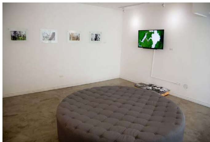
1. Villavicencio, C. Vista de exhibición Bosques (húmedos) tropicales , 2017

El trópico desnudado como tópico. 5 Ribadeneira, fotógrafa, dibujó bosques en acetato y los montó sobre bosques de ciudad para luego fotografiar las composiciones. Mientras que Villavicencio y Mergler, usando cámaras hápticas, hicieron un recorrido tocando/ filmando el jardín de la familia de Villavicencio. Su proyecto, Garden Exercises (Haptic/ Visual Identities) , investiga la visualidad digital, usando un sistema de cámaras que se activan con el tacto. “El proceso de grabación deriva en un sistema colaborativo, relacional y háptico. Los prototipos DIY que usamos están basados en tecnología inestable y que contiene errores (...). Esta obra es una forma de meditación sobre el concepto de “medio” y sobre la posibilidad del gesto háptico en un sistema dominado por la visualidad” (Mergler y Villavicencio, statement de la obra, 2017).