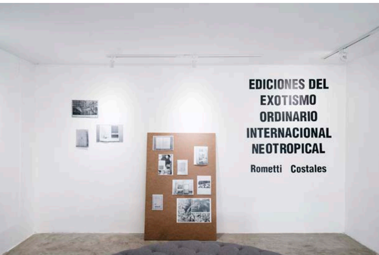
4. Scheidegger, S. Vista de exhibición, Ediciones del Exotismo Ordinario Internacional Neotropical, 2017

La cuarta y última muestra del ciclo fue Ediciones del Exotismo Ordinario Internacional Neotropical , un proyecto en curso del duo Rometti Costales.