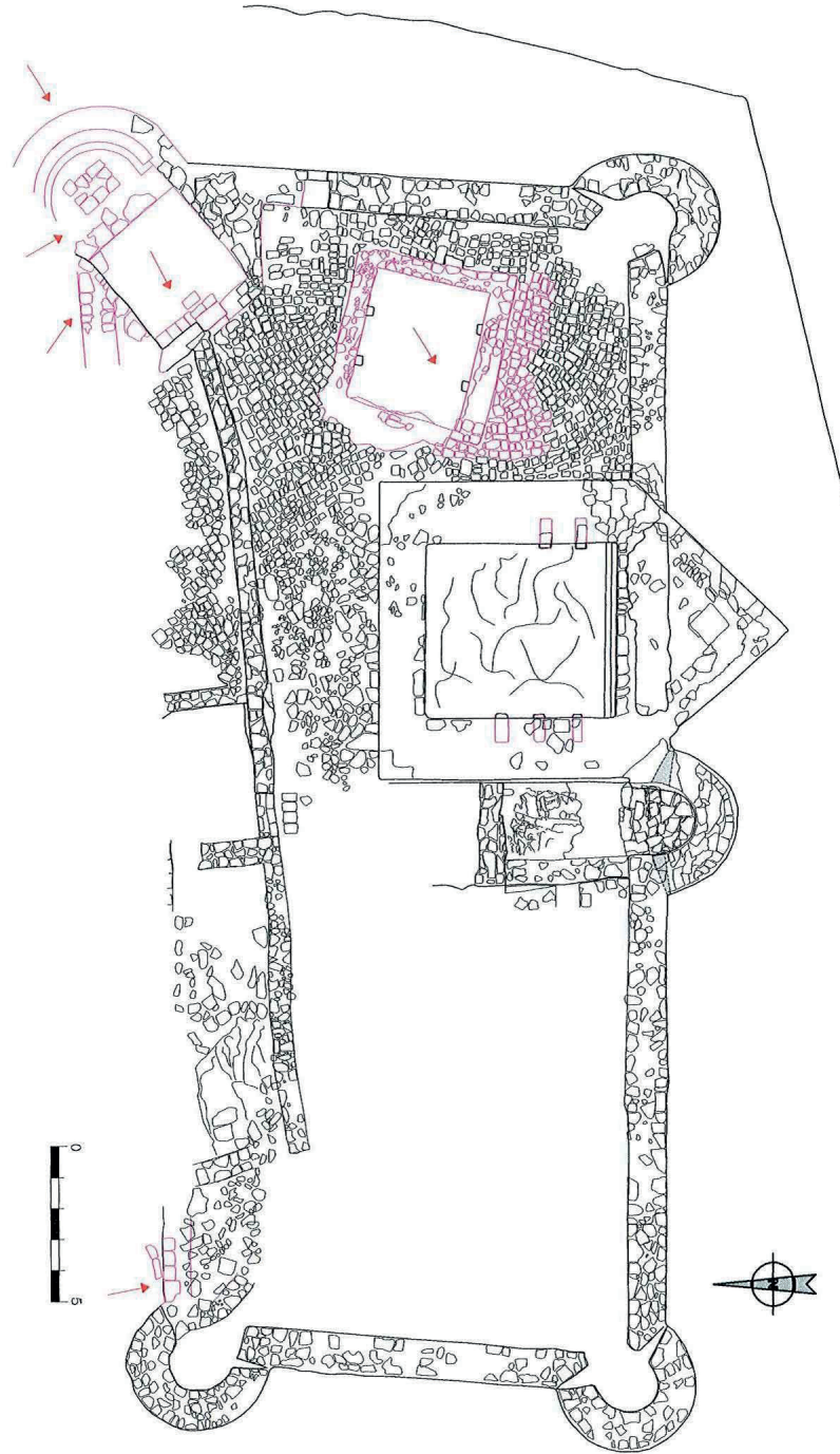
Planta del castillo de Irulegui. 2015.