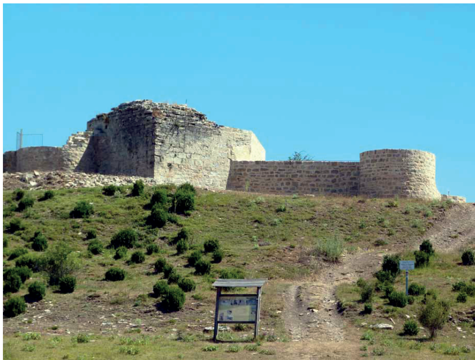
Castillo de Irulegui. Lienzo derecho del frente sur.

pagaba el recibidor, debía presentar la credencial o carta de su nombramiento, sin cuyo requisito no se le hacía efectivo.