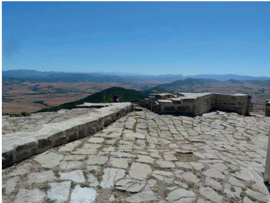
Castillo de Irulegui. Interior del recinto. suelo empedrado.

En 1378 volvieron a realizarse obras, acerca de las cuales el registro de cuentas de ese año únicamente dice que se le pagaron 23 libras y 10 sueldos al alcaide Sancho López de Uriz, " por ciertas reparaciones por eill fechas en el dicho castiello ". La orden o mandamiento para ejecutarlas se despachó el 26 de abril de ese mismo año 30 .