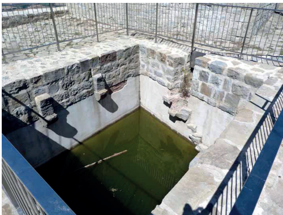
Castillo de Irulegui. Interior. Aljibe.

Hasta fechas bastantes recientes eran muy escasos los vestigios del castillo que se podían apreciar a simple vista. Como ya anotó Cañada en 1978 éstos se reducían fundamentalmente a la base de un torreón de planta cuadrada, de sillares perfectamente labrados. Sagredo publicó en 2006 varias fotografías en color, que dan fe del estado que presentaban las ruinas en ese momento. Por suerte, de entonces a ahora la situación ha cambiado mucho, en este caso para mejor. A partir del año 2007, la Sociedad de Ciencias Aranzadi ha llevado a cabo una importante labor de excavación arqueológica que ha dado como resultado la recuperación total de la planta del recinto, así como de una parte bastante considerable del alzado de sus muros y torres. Esta actuación, al igual que la realizada en Maya-Amayur, permite hacerse una idea cabal y realista de cómo era aquel castillo y el tipo al que respondían sus estructuras, tanto las puramente defensivas como las residenciales y de servicio.