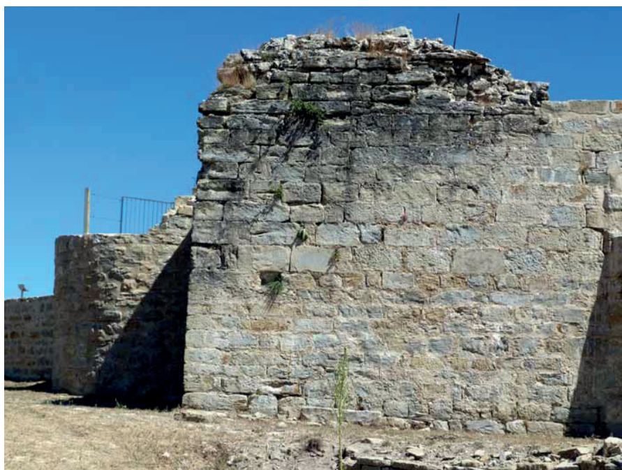
Castillo de Irulegui. Ángulo o arista del donjón o torre mayor.

La cuenta recoge la noticia de que el alcaide incluso " fizo de lo suyo otras cosas " que no aparecían consignadas en las partidas; es decir que las efectuó a sus propias expensas, al parecer a ruegos del patrimonial. Por su parte, al mazonero antes citado " que fue al dicho castieillo a fazer et tomar el dicho abís, el dicho procurador le dio por sus jornalles de ida, estada et tornada con su mession " 10 sueldos 33 .