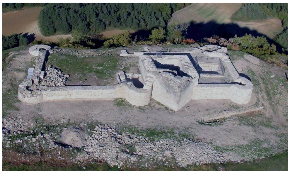
Vista aérea del castillo de Irulegui.