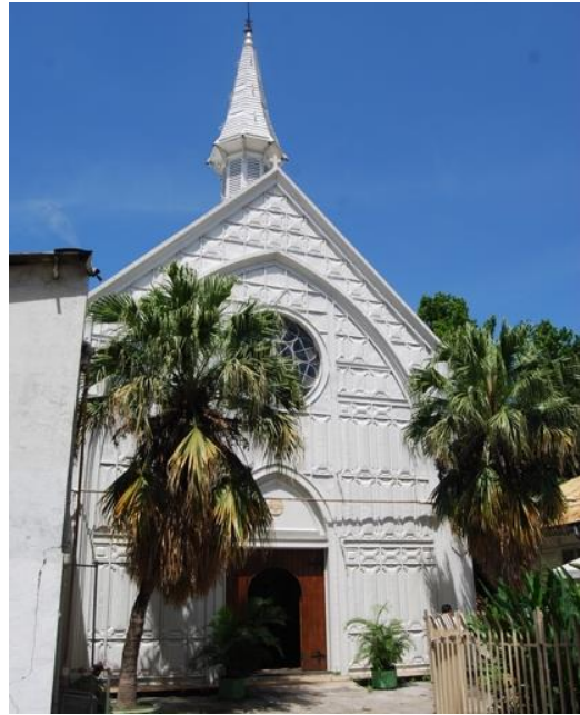
Figura 8: Detalle de la capilla al interior del Hospital Rosales (edificios diseñado ex profeso para El Salvador, por parte de la Societè des Forges de Aiseu, Bélgica).

ensamblado en El Salvador en 1891, destacable por ser íntegramente de estructura y recubrimientos metálicos con marcado estilo neogótico.