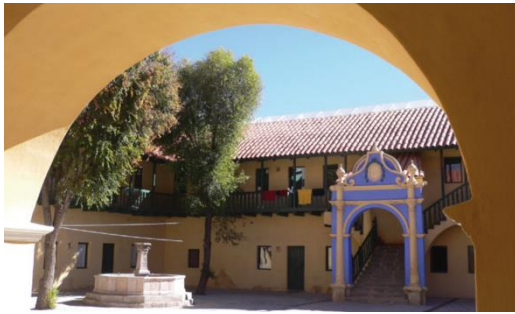
Figura 1 (superior): Estado inicial del patio. Figura 2 (inferior): Estado final desde el patio central del edificio luego de la intervención en el Pabellón de los Oficiales Reales.