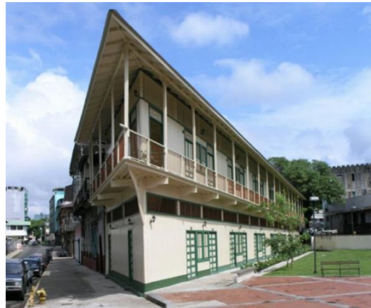
Figura 3 (superior): Estado inicial de la Casa Boyacá antes de la intervención. Figura 4 (inferior): Estado final de la Casa Boyacá luego de la intervención.