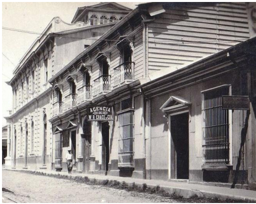
Figura 7: Casas de lámina, madera y deployer en las cercanías del Parque Bolívar, hoy Plaza Gerardo Barrios (antes de 1920).

Ambas circunstancias antes mencionadas, aceleradas por el memorable terremoto de origen volcánico del 7 de junio de 1917 con el que se define de una vez por todas la necesidad de reconstruir con materiales antisísmicos en estas primeras décadas del siglo, favorecieron la importación de materiales metálicos, principalmente desde Bélgica (Rodríguez, 2002), para reconstruir la devastada ciudad con estructura de madera y recubierta con glamorosos detalles afrancesados como se observa en la figura 7, perceptibles en el decorado de los troqueles de las láminas, en los balcones de hierro forjado o en los pisos tipo alfombra con intrincados diseños.