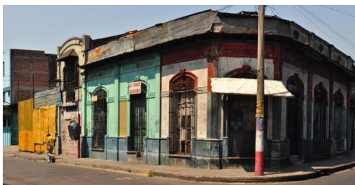
Figura 9: Casa deteriorada de lámina troquelada y madera en la Avenida Independencia (2010).

campo a la ciudad a mediados del siglo XX, lo que ocasionó la movilización de los habitantes de alto nivel socioeconómico hacia las afueras, liberando las lujosas residencias de lámina y madera para ser convertidas en mesones o piezas de alquiler con servicios comunes que albergarán a estos nuevos ocupantes. Esta situación se vio agravada tanto por el estallido de un largo proceso de guerra civil desde 1981 a 1992 según Baró (1981: 17), con la firma de los acuerdos de paz, como por la extracción de todas las principales oficinas del Estado a un nuevo Centro de Gobierno ubicado en las afueras, que terminó por sumir en un total abandono y deterioro al CHSS, como se puede observar en la figura 9.