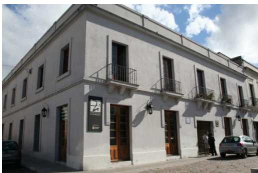
Figura 5 (superior): Estado antes de la intervención.