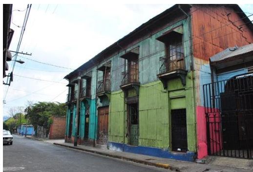
Figura 11: Arriba: Planta arquitectónica (sin escala) del primer nivel de la Casa Verde (2011). Abajo: Exterior de la Casa Verde en el que se observa la única crujía a dos niveles.

Esta Casa Verde (figura 11), resulta valiosa para el proyecto en tanto representa uno de los inmuebles habitacionales que fue edificado a principio de siglo XX utilizando materiales importados como la lámina troquelada (que se empleó en su fachada) y da muestra del sistema constructivo ligero a base de madera que se impulsó posterior a los terremotos de 1873 y 1917, siendo entonces memoria física de un pasado urbano notable para la ciudad. Además, su distribución espacial es rica en cuanto desarrolla sus crujías por medio de un patio central y traspatio para el área de servicio, la cual guarda relación con una porción del terreno que se encuentra a veinte metros por debajo del nivel de la casa y que tiene la facilidad de desarrollar una edificación en altura en esta parte, sin interrumpir la volumetría y visuales del Cerro de San Jacinto que posee el inmueble histórico.