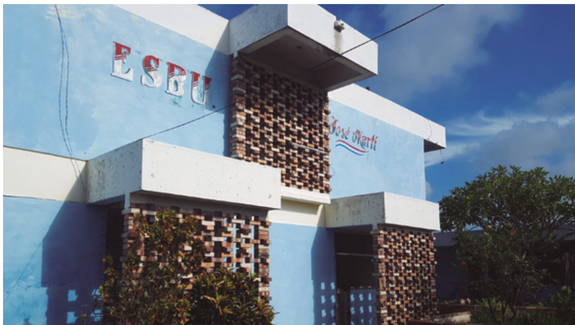
Figura 1 Escuela Secundaria Básica, municipio Florida, Camagüey, Arq. Mirta Merlo, 1961.

Como resultado de la difusión de estos proyectos típicos, en Camagüey se edificaron en los años 70 grandes conjuntos educacionales que, a pesar de la rigidez del sistema Girón, propia de los sistemas prefabricados, por el ingenio de los diseñadores se convierten en obras singulares, dada su adaptación contextual.