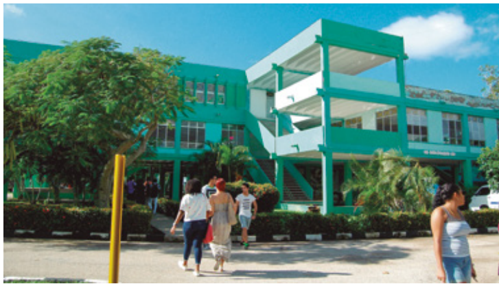
Figura 12 Comedor Universidad.