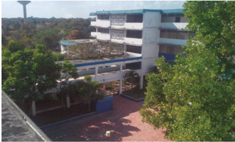
Figura 9 Detalle de los patios interiores, se privilegia el uso de los materiales locales como el barro, el tratamiento de la vegetación y del color.