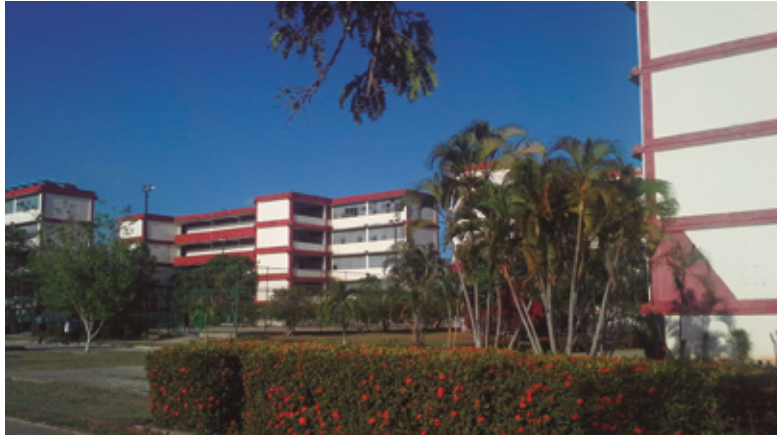
Figura 8 Bloques de edificios. Universidad de Ciencias Médicas.