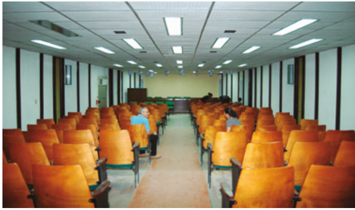
Figura 11 Paraninfo.