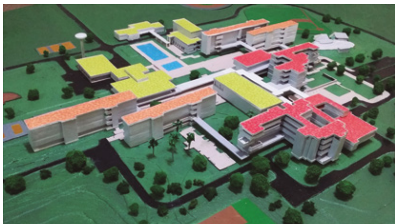
Figura 4 Maqueta de la Escuela Vocacional Máximo Gómez Báez, de Camagüey. Realizada en 1976, Reconstruida en 2017 por estudiantes de 2do Año de la carrera de Arquitectura de la Universidad de Camagüey, con motivo del 41 aniversario de la fundación de la escuela.