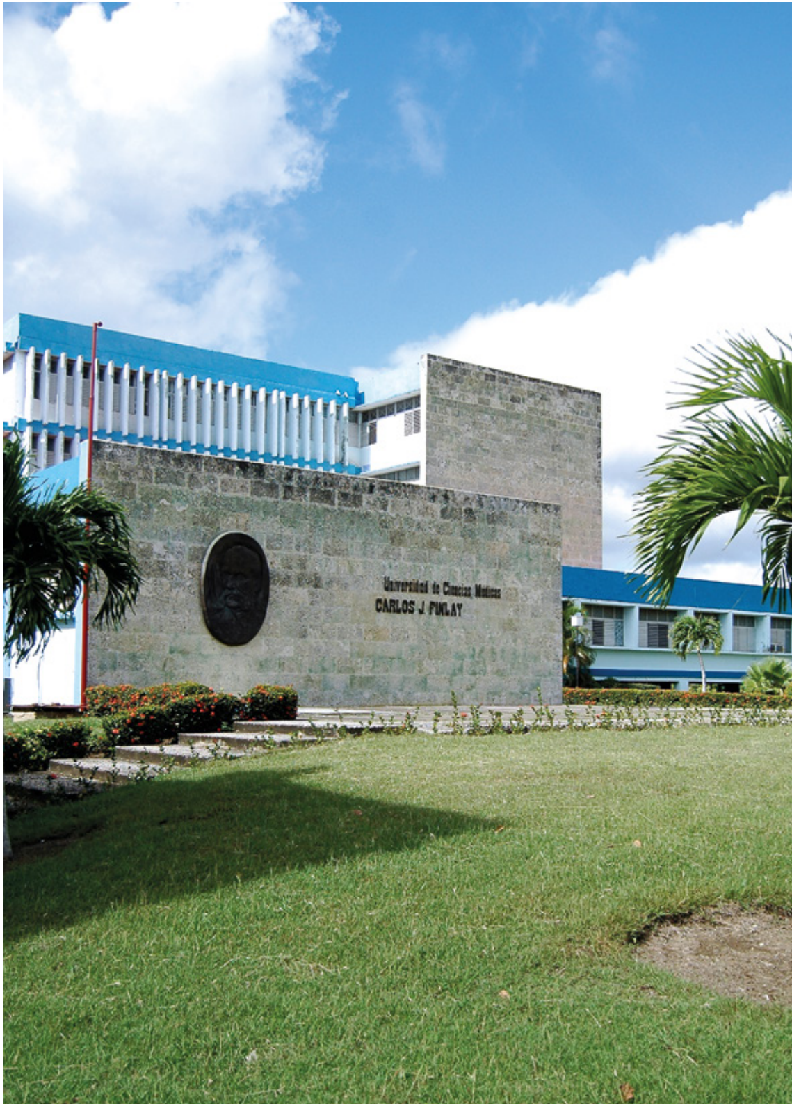
Figura 0 Entrada Universidad de Ciencias Médicas.