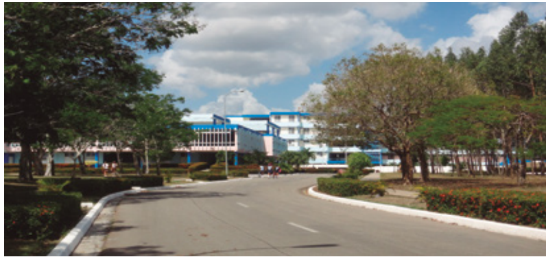
Figura 3 Escuela Vocacional Máximo Gómez Báez, de Camagüey.