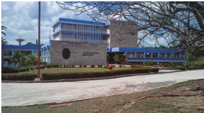
Figura 10 Acceso principal de la Universidad de Ciencias Médicas, jerarquizado por el empleo de la piedra jaimanita.