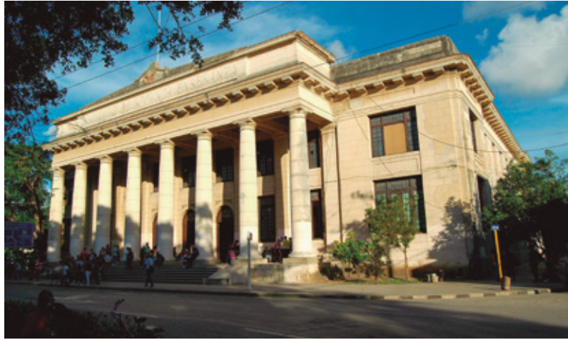
Figura 2 Instituto de Segunda Enseñanza de Camagüey, actual Instituto Preuniversitario Urbano "Álvaro Morell".