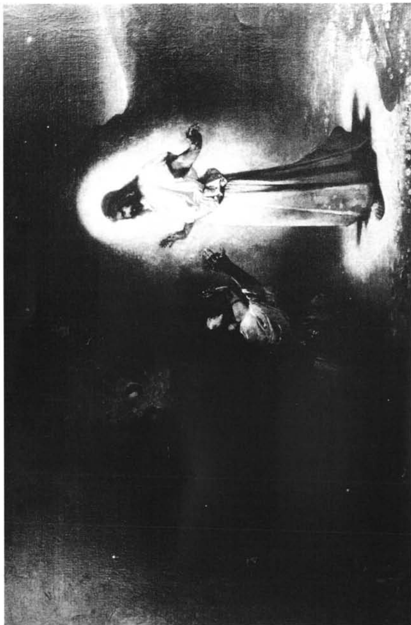
Lám. 4 "La aparición de Cristo a Magdalena". Colección particular