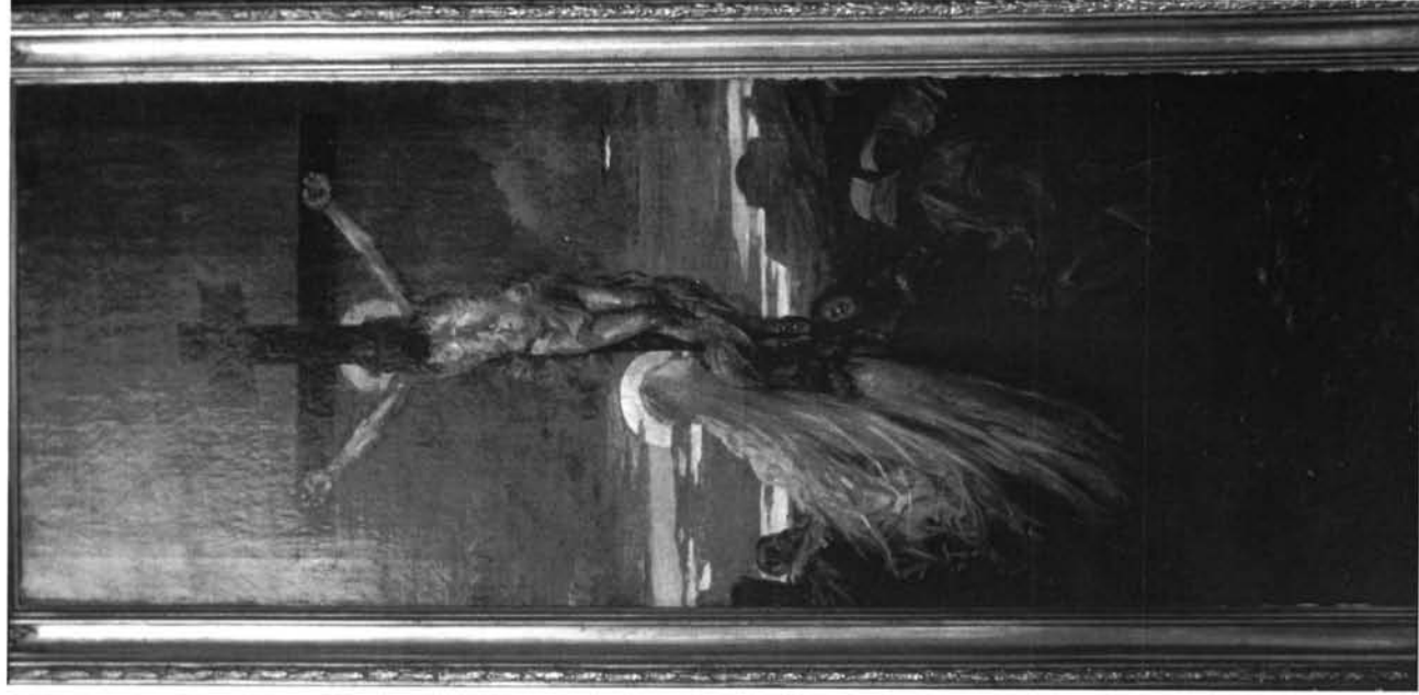
Lám. 1 "El Calvario". Colección particular