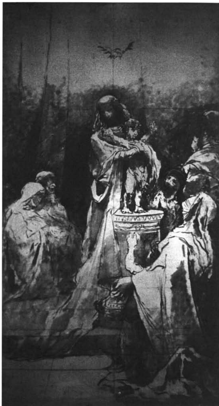
Lám. 3 "Presentación del Niño". Colección particular