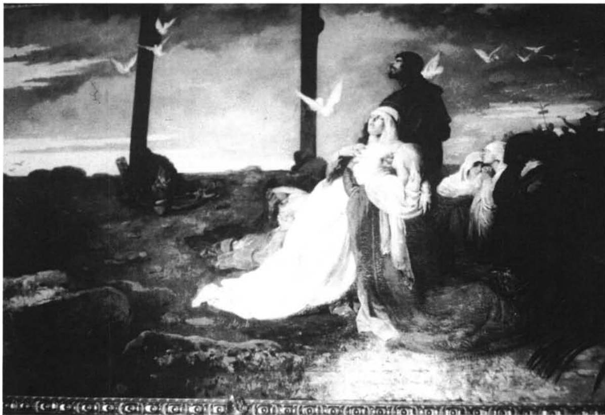
Lám. 2 "El Calvario". Colección particular